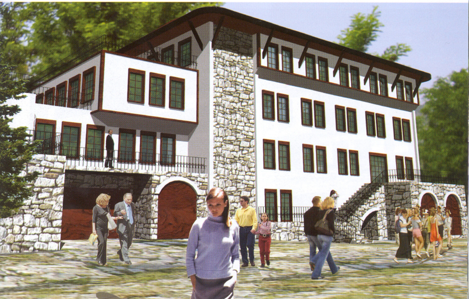
Varianti i parë i projektit të propozuar nga SPHAERA STUDIO.

Ndërhyrja e propozuar nga konsulentet konsiston në elemente