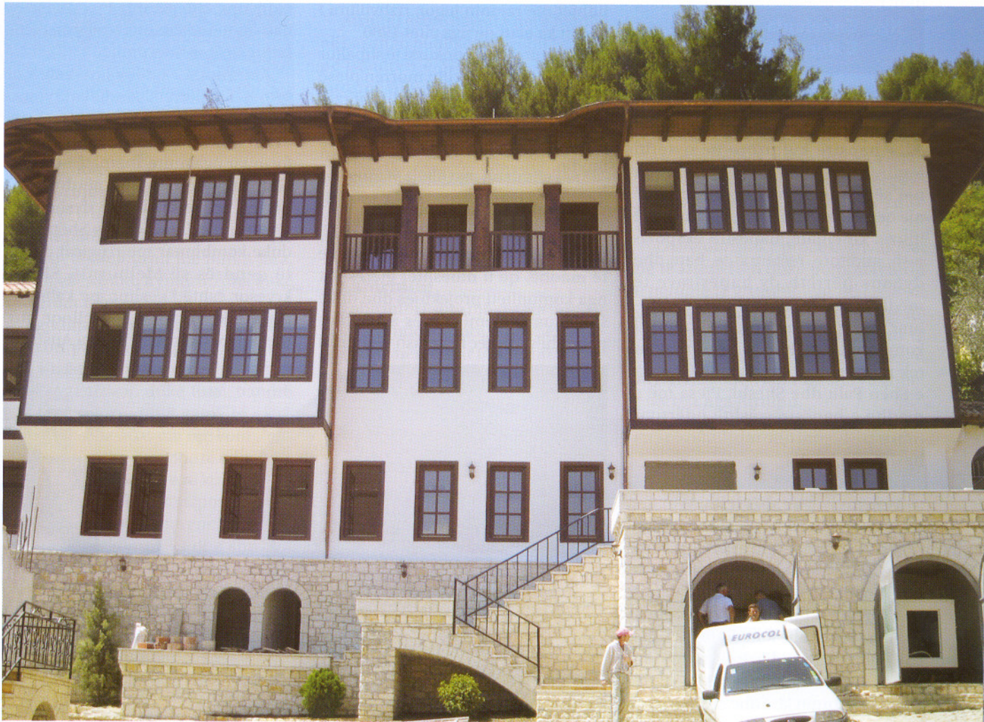
Foto e objektit në përfundim të punimeve.