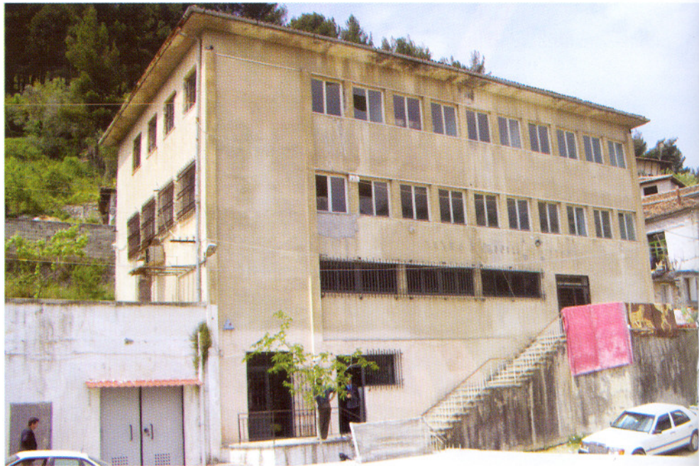
Pamja e gjendjes fillestare të Degës së Bankës së Shqipërisë Berat.

Ndërhyrja e propozuar nga konsulentet konsiston në elemente shumë të thjeshta volumore, të cilat janë përzgjedhur duke respektuar morfologjinë e banesës beratase