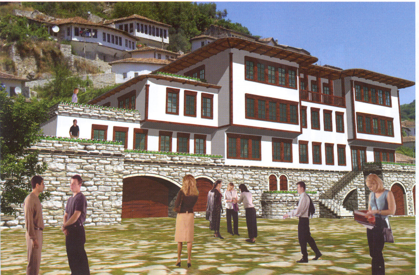
Varianti final i projektit (ark. E.Belalla, ing.rest. G.Samimi, ark. A.Biçoku).

Projekti pas hartimit ju nënshtrua një procesi diskutimi në Institutin e Monumenteve të Kulturës, dhe me