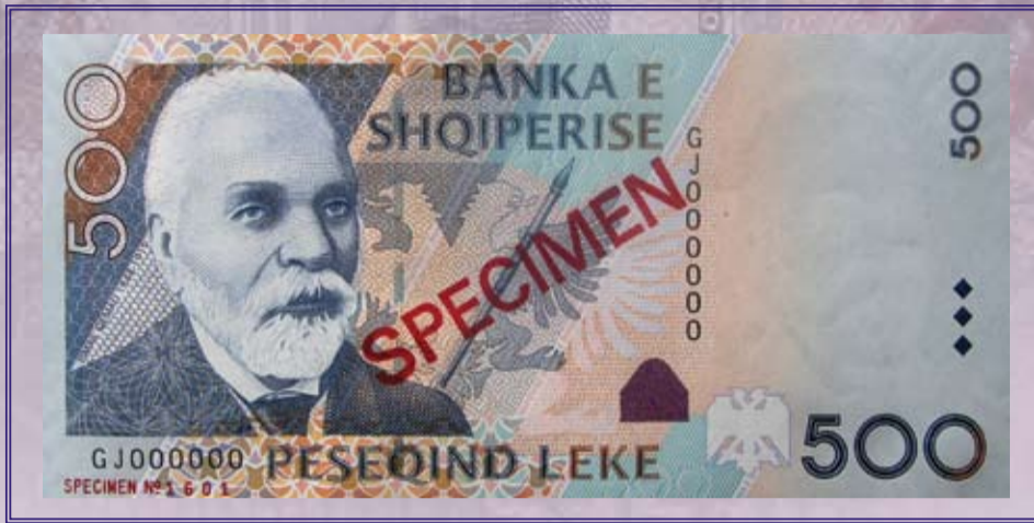
Ana e përparme