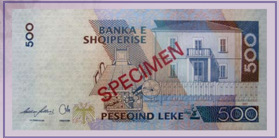
Ana e pasme

Në datën 16 shkurt 2009, Banka e Shqipërisë do të hedhë në qarkullim kartëmonedhën me prerje 500 Lekë me kurs ligjor, emetim i vitit 2007. Ajo ruan të njëjtat pamje dhe përmasa me ato të kartëmonedhës 500 Lekë, emetim i vitit 2001. Në kartëmonedhën e re janë shtuar apo përmirësuar elemente që kanë të bëjnë me sigurinë dhe me qëndrueshmërinë ndaj dëmtimeve. Janë ndryshuar firmat e Guvernatorit dhe të Drejtorit të Departamentit të Emisionit, si edhe viti i emetimit.