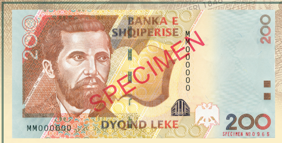
Ana e përparme