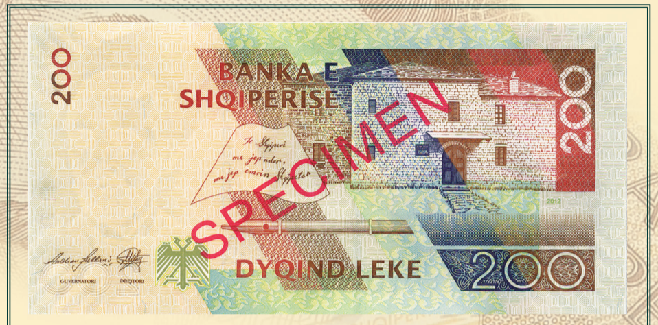
Ana e prapme

Nga data 12 shtator 2013, Banka e Shqipërisë hedh në qarkullim kartëmonedhën me prerje 200 Lekë me kurs ligjor, emetim i vitit 2012. Kartëmonedha ruan të njëjtën pamje dhe dimensione me ato të kartëmonedhës 200 Lekë, emetim i vitit 1996, rishtypur në vitin 2001 dhe në vitin 2007. Në kartëmonedhën e re janë shtuar apo përmirësuar elementë që kanë të bëjnë me sigurinë. Gjithashtu, kanë ndryshuar edhe firma e Drejtorit të Departamentit të Emisionit, si edhe viti i emetimit.