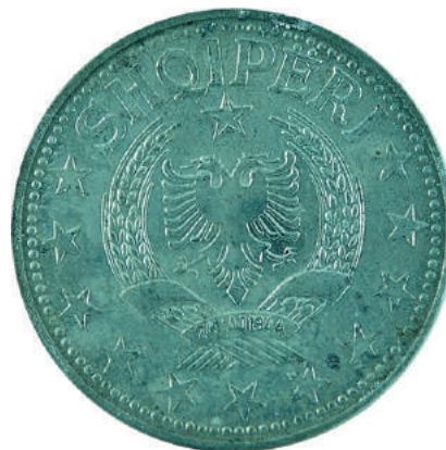
Sh. Stema e republikës në qendër, rrethuar në 3/4 me yje; shkruar në hark sipër "SHQIPËRI".