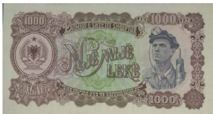
Sh. Majtas stema e republikës; djathtas portreti i një minatori; në qendër vlera nominale. Sipër "BANKA E SHETIT SHQIPTAR"; poshtë "LIGJA DËNON ATA QË FABRIKOJNË DHE NDAJNË BILETA TË FALSIFIKUARA".