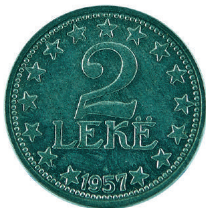
F. Vlera në qendër me yje përreth; në hark poshtë viti i shtypjes "1957".