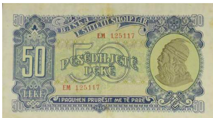
F. Në qendër vlera me shifra dhe me shkronja; djathtas portreti i Skënderbeut. Sipër "BANKA E SHETIT SHQIPTAR"; poshtë "I PAGUHEN PRURËSIT ME TË PARË".