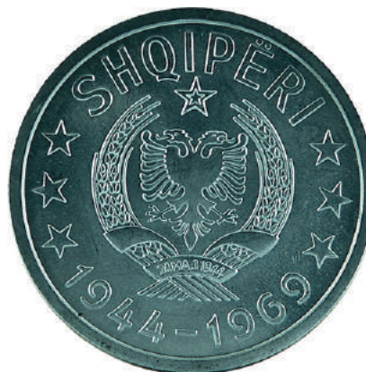
Sh. Në qendër stema e republikës; sipër shkruhet "SHQIPËRI", poshtë vitet "1944-1969", ndërsa përreth 6 yje.