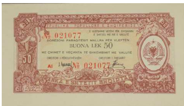
F. Vlera nominale; në të djathtë stema e republikës. Sipër "REPUBLIKA POPULLORE E SHQIPËRISË"; poshtë "BANKA E SHTETIT SHQIPTAR".

Viti i emetimit: 1965 Emetuar nga: Ministria e Financave (sasi e limituar) Përmasat: 129 x 72 mm Shtypur në: Shqipëri Ngjyra: E kuqërremtë Çmimi: 15536.4 Lekë