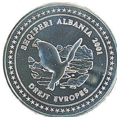
Sh. Në qendër një pëllumb. Në hark "Shqipëri Albania 2001" dhe "Drejt Evropës".