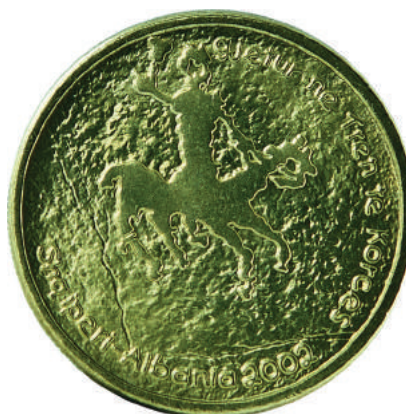
Sh. Në qendër një gjetje antike. Në hark "Gjetur në Tren të Korçës" dhe "Shqipëri - Albania 2002".