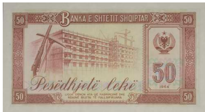
Sh. Pushkë, kazmë dhe pallat në ndërtim. Djathtas stema e republikës, vlera dhe viti i shtypjes. Sipër "BANKA E SHETIT SHQIPTAR"; poshtë "LIGJA DËNON ATA QË FABRIKOJNË DHE NDAJNË BILETA TË FALSIFIKUARA".