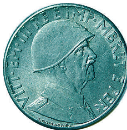
Sh. Bust me helm të Viktor Emanuelit III, djathtas; mbishkrimi "VITT. EM. III. REE. IMP. MBRET. E. PER.".