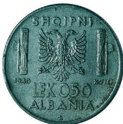
F. Shqiponja dykrenore mes dy "fascio"-ve (tufë shkopinësh të lidhur dhe një sëpatë), simbole të fashizmit; vitet "1940" "XVIII" dhe vlera. Në hark "SHQIPNI" dhe "ALBANIA".

Materiali dhe pastërtia: Çelik Pesha: 6,00 g Përmasat: Ø 24.2 mm; thellësia e monedhës: 2 mm Emetuar nga: Banka Kombëtare e Shqipnis Shtypur në: Zecca di Roma, Mbretëria e Italisë Autorë: Skulptor Giuseppe Romagnoli dhe gdhendës Attilio Motti Çmimi: 157.2 Lekë