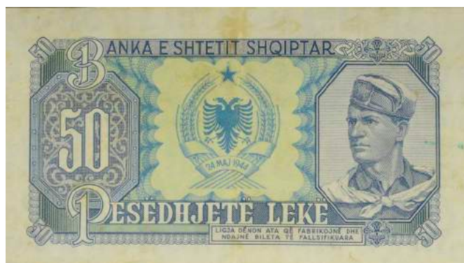
F. Në qendër vlera nominale; djathtas portreti i Skënderbeut. Sipër Sh. Vlera nominale dhe stema e republikës; majtas portreti i një ushtari. Sipër "BANKA E SHTEJIT SHQIPTAR"; poshtë "LIGJA DËNON ATA QË FABRIKOJNË DHE NDAJNË BILETA TË FALSIFIKUARA".