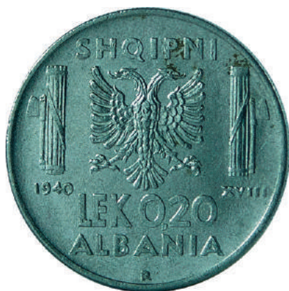
F. Shqiponja dykrenore mes dy "fascio"-ve (tufë shkopinësh të lidhur dhe një sëpatë), simbole të fashizmit; vitet "1940" "XVIII" dhe vlera. Në hark "SHQIPNI" dhe "ALBANIA".

Materiali dhe pastërtia: Çelik Pesha: 4,00 g Përmasat: Ø 21.7 mm; thellësia e monedhës: 1.7 mm Emetuar nga: Banka Kombëtare e Shqipnis Shtypur në: Zecca di Roma, Mbretëria e Italisë Autorë: Skulptor Giuseppe Romagnoli Çmimi: 104.4 Lekë