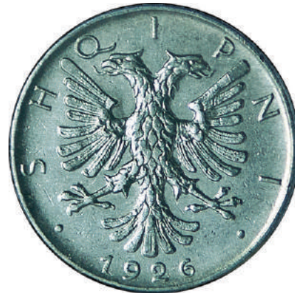
Sh. Shqiponja heraldike shqiptare. Në hark "SHQIPNI" dhe viti i shtypjes poshtë.