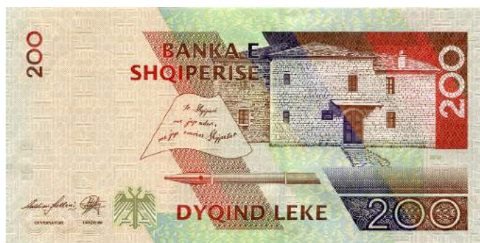
Sh. Shtëpia ku lindi Naim Frashëri, një fletë me vargjet të tij. Sipër "BANKA E SHQIPERISE".