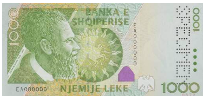
F. Pjetër Bogdani (1625-1689), autor i veprës së parë origjinale në gjuhën shqipe "Çeta e Profetëve"; një simbol i tij për diellin. Sipër "BANKA E SHQIPERISE".