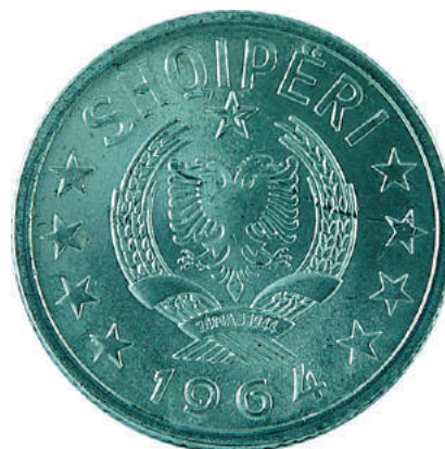
Sh. Në qendër stema e republikës; sipër "SHQIPËRI"; poshtë viti i emetimit "1964".