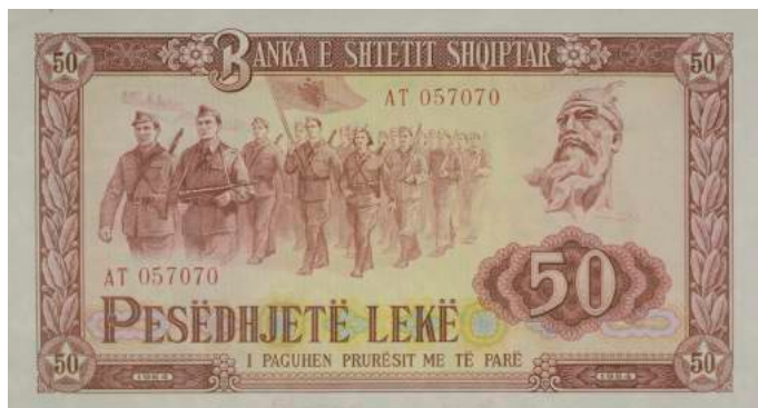
F. Marshim partizanësh; djathtas bust i Heroit Kombëtar Gjergj Kastrioti Skënderbeu, vlera nominale dhe viti i emetimit. Sipër "BANKA E SHETIT SHQIPTAR"; poshtë "I PAGUHEN PRURËSIT ME TË PARË".