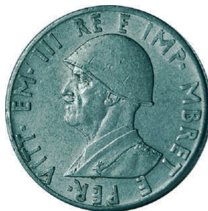
Sh. Bust me helm të Viktor Emanuelit III, majtas; mbishkrimi "VITT. EM. III. REE. IMP. MBRET. E. PER. ".