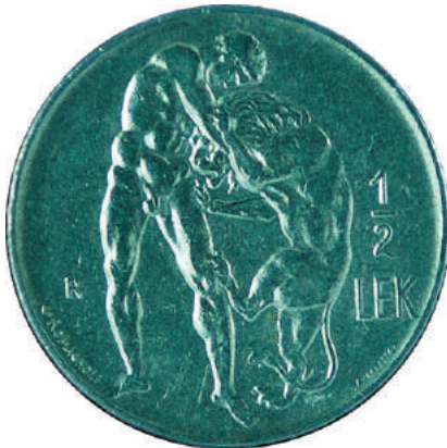
F. Herkuli duke u ndeshur me luanin e Nemeas; vlera "1/2 LEK" emrat e artistëve realizues.