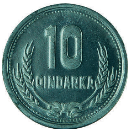
F. Në qendër vlera nominale; poshtë kallinj gruri të lidhur me fjongo.

Materiali dhe pastërtia: Alumin Pesha: 1.1 g Përmasat: Ø 20.2 mm; thellësia e monedhës 2 mm Emetuar nga: Banka e Shtetit Shqiptar Shtypur në: Shqipëri Autori: Kujtim Qamo Çmimi: 88.8 Lekë