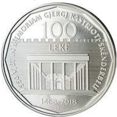
F. Memoriali i Gjergj Kastrioti Skënderbeut në Lezhë. Shkrimet "100 LEKË" dhe "550 VJET IN MEMORIAM GJERGJ KASTRIOTI SKËNDERBEU 1468 - 2018".