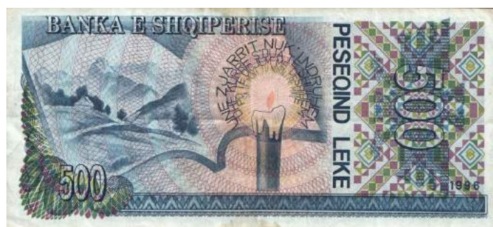
Sh. Në qendër një qiri me përreth disa vargje të poetit Naim Frashëri. Sipër "BANKA E SHQIPËRISË".