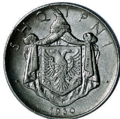
Sh. Shqiponja heraldike shqiptare. Në hark "SHQIPNI" dhe viti i shtypjes poshtë.