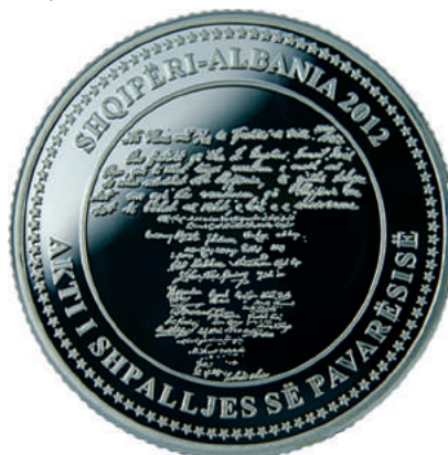
Sh. Në qendër Akti i Pavarësisë. Në hark sipër “SHQIPËRI - ALBANIA 2012” dhe poshtë “AKTI I SHPALLJES SË PAVARËSISË”. Përqark 100 yje.