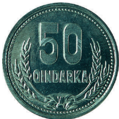
F. Në qendër vlera nominale; poshtë kallinj gruri të lidhur me fjongo.