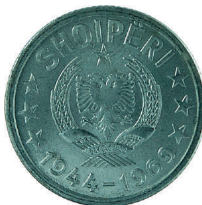
Sh. Stema e republikës e rrethuar me yje; në hark sipër shkrimi "SHQIPËRI" dhe poshtë vitet "1944-1969".