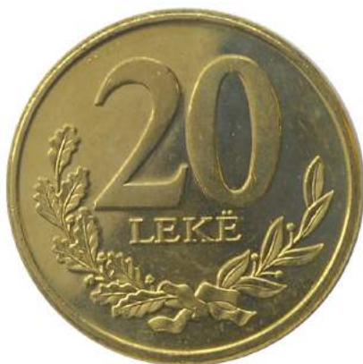
F. Vlera emërore dhe degë në formë kurore.

Pesha: 5 g Diametri: 22.5 mm Materiali: përzierje bronc-alumin Ngjyra: e verdhë Forma: e dhëmbëzuar Hedhur në qarkullim: Çmimi: 72 Lekë