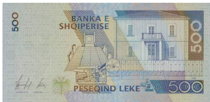
Sh. Ndërtesa ku u shpall Pavarësia, telegrafi me të cilin u përhap lajmi dhe dhoma ku u mor vendimi. Sipër "BANKA E SHQIPERISE".