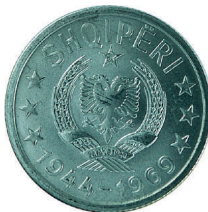
Sh. Stema e republikës e rrethuar me yje; në hark sipër shkrimin "SHQIPËRI" dhe poshtë vitet "1944-1969".