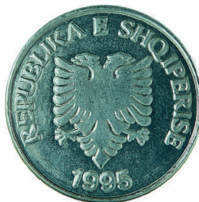
Sh. Në qendër shqiponja e flamurit. Në hark sipër "REPUBLIKA E SHQIPERISE"; poshtë "1995".