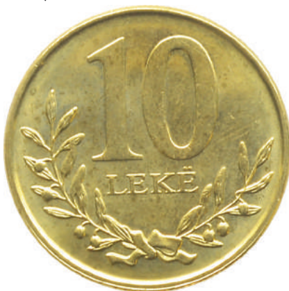
F. Vlera emërore dhe degë në formë kurore.