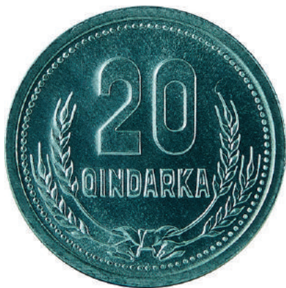
F. Në qendër vlera nominale; poshtë kallinj gruri të lidhur me fjongo.

Materiali dhe pastërtia: Alumin Pesha: 1.6 g Përmasat: Ø 22.2 mm; thellësia e monedhës 2 mm Emetuar nga: Banka e Shtetit Shqiptar Shtypur në: Shqipëri Autori: Kujtim Qamo Çmimi: 88.8 Lekë