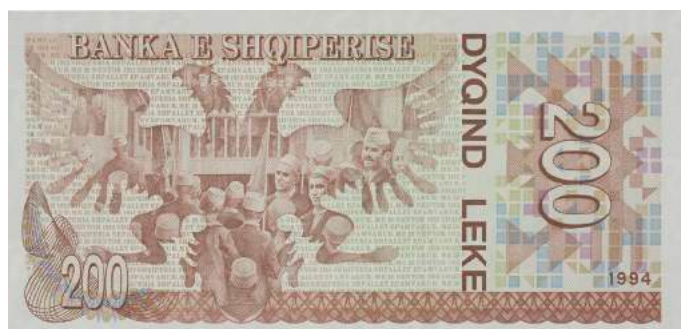
Sh. Në qendër një shqiponjë dhe ndërtesa ku u shpall Pavarësia e Shqipërisë. Sipër "BANKA E SHQIPËRISË".