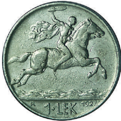
F. Alegori e heroit Skënderbe duke kalëruar. Poshtë ka vlerën "1 LEK" dhe vitin e shtypjes.