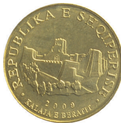
Sh. Në qendër Kalaja e Beratit. Në hark "Republika e Shqipërisë" dhe "2009".