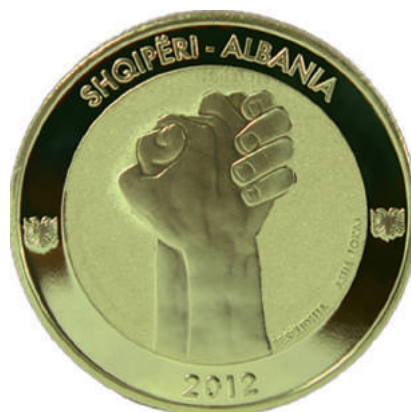
Sh. Dy duar të bashkuara fort me njëra-tjetrën; titulli i skulpturës “Besëlidhja” dhe emri i skulptorit. Në hark “SHQIPËRI - ALBANIA” dhe viti jubilar.