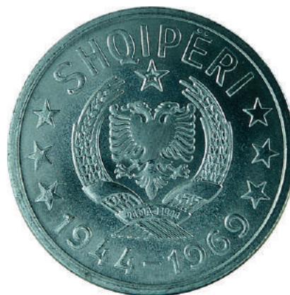
Sh. Stema e republikës e rrethuar me yje; në hark sipër shkrimi "SHQIPËRI" dhe poshtë vitet "1944-1969".