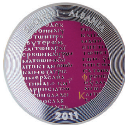
Sh. Shkrime nga Kodiku me ngjyrë të argjenditë; dy gërma me ngjyrë të artë. Në hark "Shqipëri-Albania" dhe "2011".