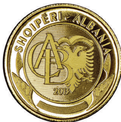
Sh. Tre gjerat e para të alfabetit, libër dhe shqiponjë. Sipër “SHQIPËRI-ALBANIA”, poshtë “2013”.