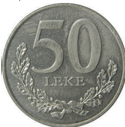
F. Vlera emërore dhe degë në formë kurore.