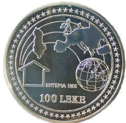
F. Ka të shkruar "Shtëpia ime" dhe vlerën; një shtëpi, harta e Evropës dhe Globi, e gjitha e rrethuar me yje.

Materiali dhe pastërtia: Argjend, 925/1000 Pesha: 15.70 g Diametri: 32.65 mm Tirazhi: 3000 copë Autori: piktori Gentian Gjikopulli Shtypur në: "Monnaie de Paris", Francë Çmimi i kësaj monedhe rishikohet çdo fillim muaji. https://www.bankofalbania.org/Muzeu_dhe_Edukimi/Muzeu_i_Bankes_se_Shqiperise/Dyqani_i_Muzeut_te_Bankes_se_Shqiperise/