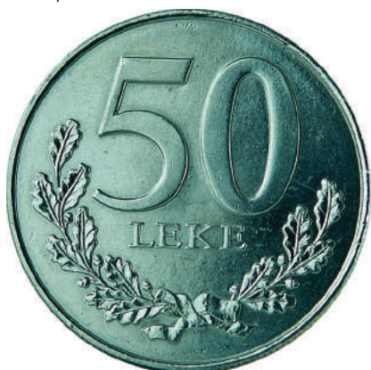
F. Vlera emërore dhe degë në formë kurore.