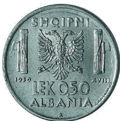
F. Shqiponja dykrenore mes dy "fascio"-ve (tufë shkopinjsh të lidhur dhe një sëpatë), simbole të fashizmit; vitet "1939" "XVIII" dhe vlera. Në hark "SHQIPNI" dhe "ALBANIA".

Materiali dhe pastërtia: Çelik Pesha: 6,00 g Përmasat: Ø 24 mm; thellësia e monedhës: 2 mm Emetuar nga: Banka Kombëtare e Shqipnis Shtypur në: Zecca di Roma, Mbretëria e Italisë Autorë: Skulptor Giuseppe Romagnoli Çmimi: 208.8 Lekë