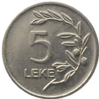
F. Vlera emërore dhe degë në formë kurore.

Pesha: 3.60 g Diametri: 21.25 mm Materiali: çelik i veshur me përzierje bakër-zink Ngjyra: e verdhë Forma: e dhëmbëzuar Hedhur në qarkullim: 01.12.2014 Shtypur në: BAVARIAN STATE MINT Çmimi: 36 Lekë