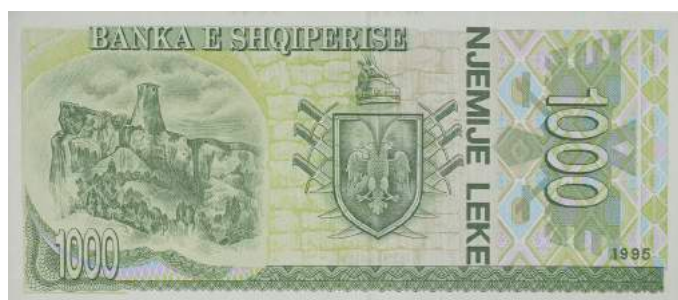
Sh. Në qendër emblema e Heroit Kombëtar, Gjergj Kastrioti Skënderbeut; majtas Kalaja e Krujës. Sipër "BANKA E SHQIPËRISË".