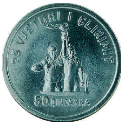
F. Në qendër një punëtor dhe një ushtar, duke mbajtur një pishtar të ndezur lart. Poshtë vlera; sipër "25-VJETORI I ÇLIRIMIT".