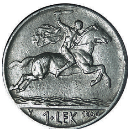
F. Alegori e heroit Skënderbe duke kalëruar. Poshtë ka vlerën "1 LEK" dhe vitin e shtypjes.

Materiali dhe pastërtia: Nikel Pesha: 8,00 g Përmasat: Ø 26.5 mm; thellësia e monedhës: 2.2 mm Emetuar nga: Banka Kombëtare e Shqipnis Shtypur në: Vjenë, Austri Autorë: Skulptor Giuseppe Romagnoli dhe gdhendës Attilio Motti Çmimi: 157.2 Lekë