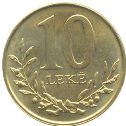
F. Vlera emërore dhe degë në formë kurore.

Pesha: 3.60 g Diametri: 21.25 mm Materiali: bakër-nikel-alumin/çelik i veshur me përzierje bakër-zink Ngjyra: e verdhë Forma: e dhëmbëzuar Hedhur në qarkullim: Çmimi: 36 Lekë