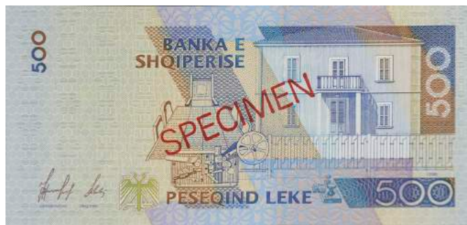
Sh. Ndërtesa ku u shpall Pavarësia, telegrafi me të cilin u përhap lajmi dhe dhoma ku u mor vendimi. Sipër "BANKA E SHQIPERISE".