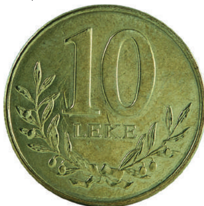
F. Vlera emërore dhe degë në formë kurore.