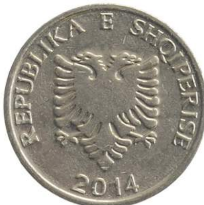
Sh. Në qendër Kalaja e Beratit. Në hark "Republika e Shqipërisë" dhe "2014".