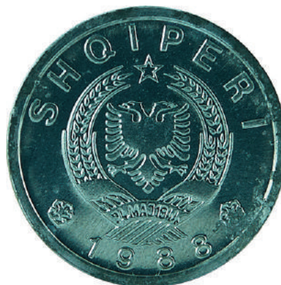
Sh. Stema e republikës; në hark sipër shkrimi "SHQIPËRI" dhe poshtë viti "1988".