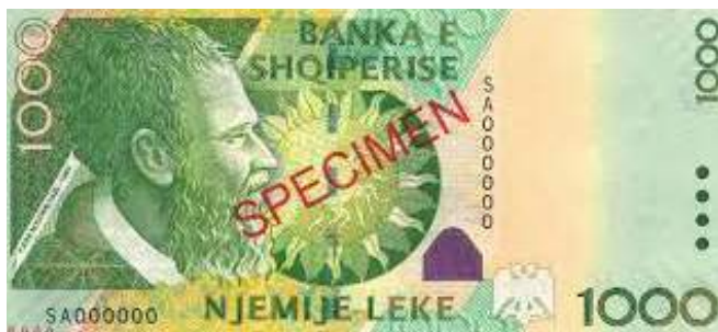
F. Pjetër Bogdani (1625-1689), autor i veprës së parë origjinale në gjuhën shqipe "Çeta e Profetëve"; një simbol i tij për diellin. Sipër "BANKA E SHQIPERISE".