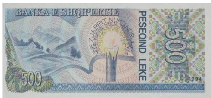
Sh. Në qendër një qiri me përreth disa vargje të poetit Naim Frashëri. Sipër "BANKA E SHQIPËRISË".