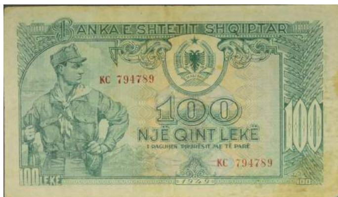
F. Në qendër vlera nominale dhe stema e republikës; Majtas portreti i një ushtari. Sipër "BANKA E SHTETIT SHQIPTAR"; poshtë "I PAGUHET PRURËSIT ME TË PARË".