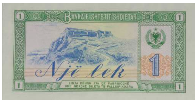
Sh. Në qendër Kalaja e Rozafës (Shkodër); djathtas vlera nominale dhe stema e republikës. Sipër "BANKA E SHETIT SHQIPTAR"; poshtë "LIGJA DËNON ATA QË FABRIKOJNË DHE NDAJNË BILETA TË FALSIFIKUARA".