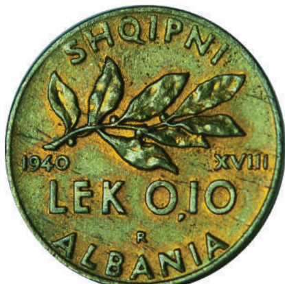
F. Shqiponja dykrenore mes dy "fascio"-ve (tufë shkopinjshtë të lidhur dhe një sëpatë), simbole të fashizmit; vitet "1940" "XVIII" dhe vlera. Në hark "SHQIPNI" dhe "ALBANIA".

Materiali dhe pastërtia: Bronx Alumin Pesha: 4,9 g Përmasat: Ø 22.5 mm; thellësia e monedhës: 1 mm Emetuar nga: Banka Kombëtare e Shqipnis Shtypur në: Zecca di Roma, Mbretëria e Italisë Autorë: Skulptor Giuseppe Romagnoli Çmimi: 417.6 Lekë