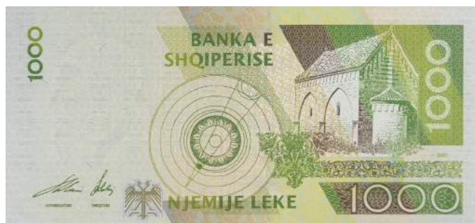
Sh. Sistem heliocentrik sipas Bogdanit; pamje e kishës së Vaut të Dejës. Sipër "BANKA E SHQIPERISE".