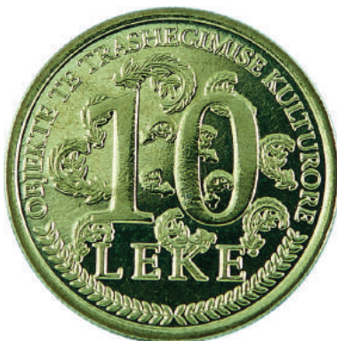
F. Në pamjen kryesore vlera emërore. Në hark "Objekte të trashëgimisë kulturore".