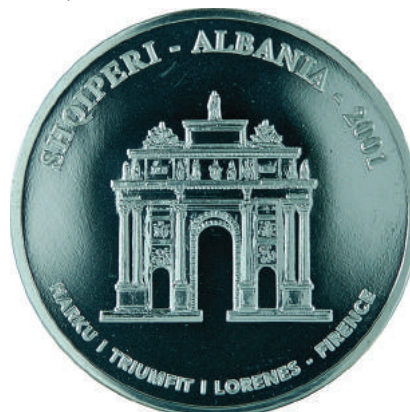
Sh. Në qendër Harku i Triumfit të Lorenës në Firence. Në hark sipër "Shqipëri-Albania 2001".