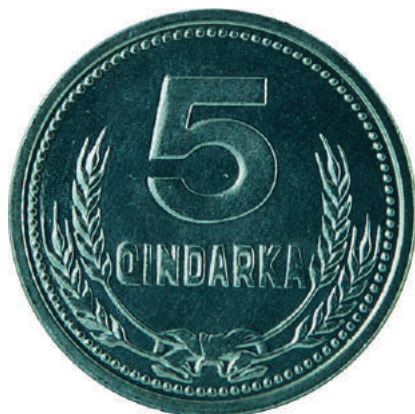
F. Në qendër vlera nominale; poshtë kallinj gruri të lidhur me fjongo.