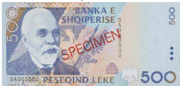
F. Ismail Qemali (1844-1919), udhëheqës i lëvizjes kombëtare dhe kryeministër i Shqipërisë së pavarur; shqiponja dhe pena. Sipër "BANKA E SHQIPERISE".