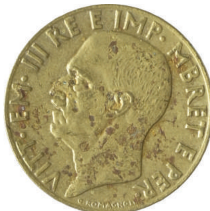
Sh. Bust me helm të Viktor Emanuelit III, djathtas; mbishkrimi "VITT. EM. III. REE. IMP. MBRET. E. PER.".