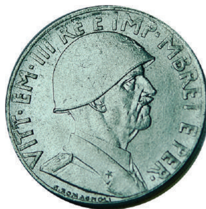
Sh. Bust me helm të i Viktor Emanuelit III, djathtas; mbishkrimi "VITT. EM. III. REE. IMP. MBRET. E PER.".