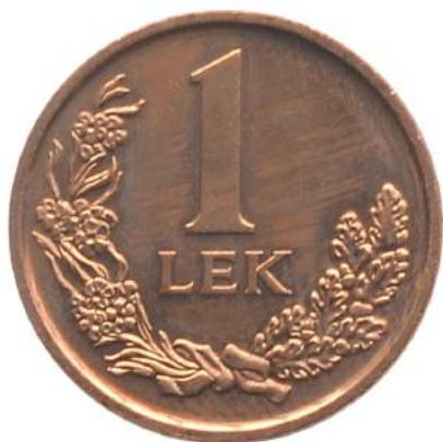
F. Vlera emërore dhe një degë ulliri anës vlerës.

Pesha: 3.00 g Diametri: 18 mm Materiali: përzierje bakër-zink Ngjyra: Bakri Forma: e sheshtë Hedhur në qarkullim: 01.12.2014 Çmimi: 7.2 Lekë