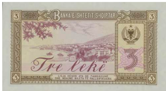
Sh. Pamje nga qyteti i Sarandës; djathtas stema e republikës dhe vlera nominale. Sipër "BANKA E SHTETIT SHQIPTAR"; poshtë "LIGJA DËNON ATA QË FABRIKOJNË DHE NDAJNË BILETA TË FALSIFIKUARA".