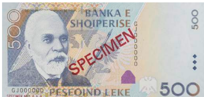
F. Ismail Qemali (1844-1919), udhëheqës i lëvizjes kombëtare dhe kryeministër i Shqipërisë së pavarur; shqiponja dhe pena. Sipër "BANKA E SHQIPERISE".