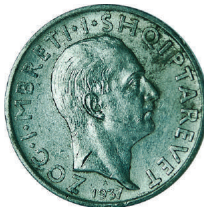
Sh. Profili i Ahmet Zogut, djathtas; përreth "ZOG.I.MBRET.I.SHQIPTAREVET", poshtë viti "1937".