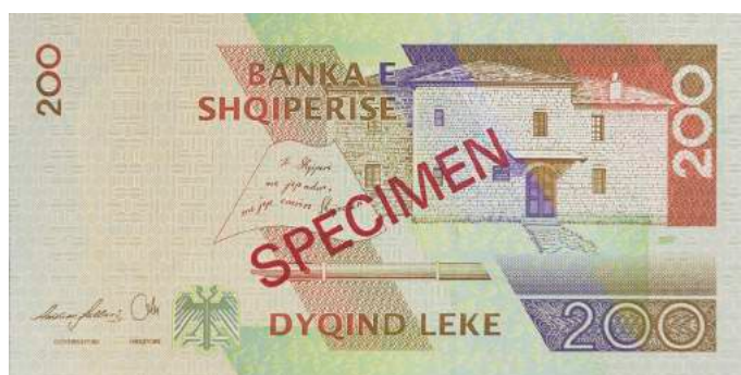
Sh. Shtëpia ku lindi Naim Frashëri, një fletë me vargjet të tij. Sipër "BANKA E SHQIPERISE".