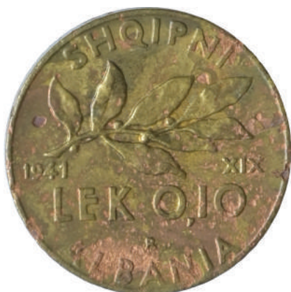
F. Degë dafine; vitet "1941" "XIX" dhe vlera. Në hark "SHQIPNI" dhe "ALBANIA".

Materiali dhe pastërtia: Bronx Alumin Pesha: 4,9 g Përmasat: Ø 22.5 mm; thellësia e monedhës: 1 mm Emetuar nga: Banka Kombëtare e Shqipnis Shtypur në: Zecca di Roma, Mbretëria e Italisë Autorë: Skulptor Giuseppe Romagnoli Çmimi: 1015.2 Lekë