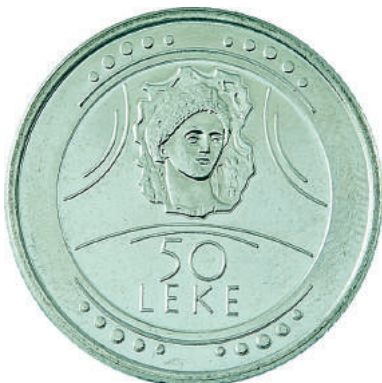
F. Mozaiku "Bukuroshja e Durrësit" rrethuar me motive floreale. Në hark motive dekorative të periudhës ilirike.