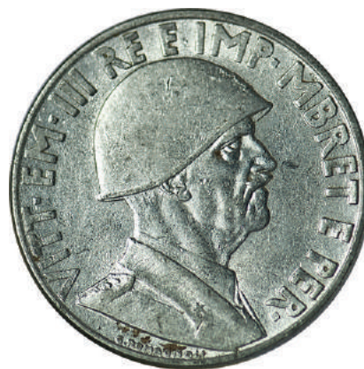
Sh. Bust me helmetë i Viktor Emanuelit III, djathtas; mbishkrimi "VITT. EM. III. REE. IMP. MBRET. E. PER. ".