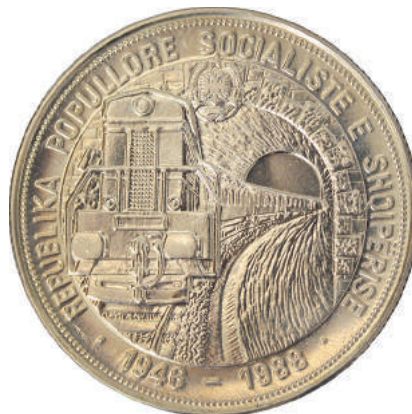
Sh. Në qendër ka trenin për pasagjerë me naftë duke dalë nga tuneli dhe mbishkrimi "REPUBLIKA POPULLORE SOCIALISTE E SHQIPËRISË"; poshtë vitet "1948-1988".