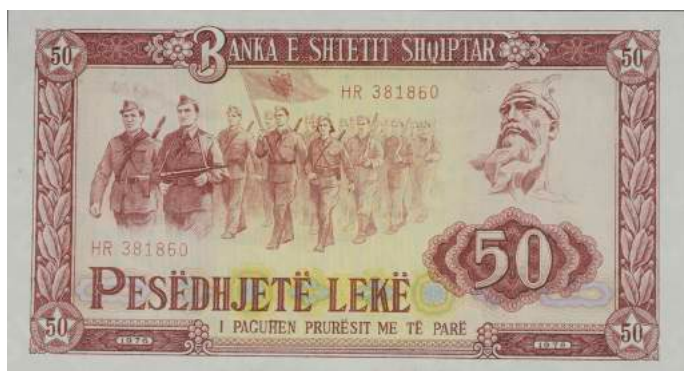
F. Marshim partizanësh; djathtas bust i Heroit Kombëtar Gjergj Kastrioti Skënderbeu, vlera nominale dhe viti i emetimit. Sipër "BANKA E SHETIT SHQIPTAR"; poshtë "I PAGUHET PRURËSIT ME TË PARË".