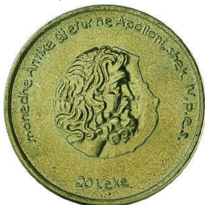
F. Në qendër monedhë antike. Në hark "Monedhë antike gjetur në Apolloni shek. IV p.e.s." dhe "20 Lekë".