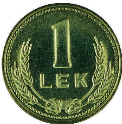
F. Në qendër vlera nominale; poshtë kallinj gruri të lidhur me fjongo.