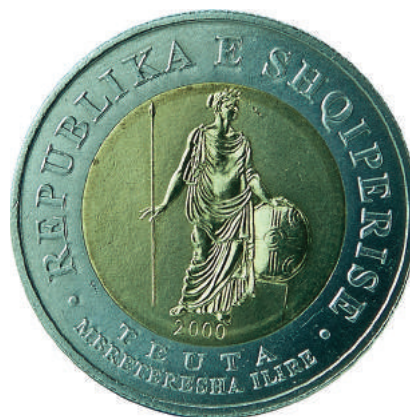
Sh. Në qendër mbretëresha ilire Teuta me mburojë dhe heshtë; viti "2000". Në hark "Republika e Shqipërisë"; "Teuta, mbretëresha ilire".