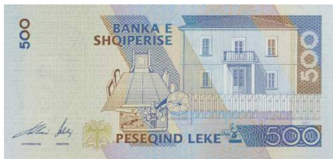
Sh. Ndërtesa ku u shpall Pavarësia, telegrafi me të cilin u përhap lajmi dhe dhoma ku u mor vendimi. Sipër "BANKA E SHQIPERISE".