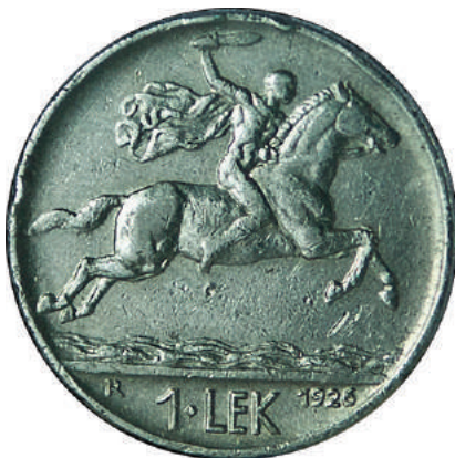
F. Alegori e heroit Skënderbe duke kalëruar. Poshtë ka vlerën "1 LEK" dhe vitin e shtypjes.