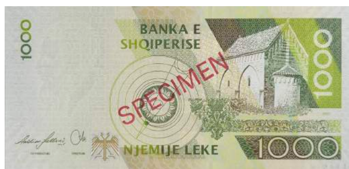
F. Pjetër Bogdani (1625-1689), autor i veprës së parë origjinale në gjuhën shqipe "Çeta e Profetëve"; një simbol i tij për diellin. Sipër "BANKA E SHQIPERISE".