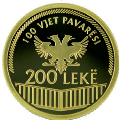
F. Shqiponja dykrenore e flamurit të ngritur në Vlorë; vlera emërore. Në hark "100 VJET PAVARËSI" dhe xhufkat (thekët) që rrethojnë flamurin.

https://www.bankofalbania.org/Muzeu_dhe_Edukimi/Muzeu_i_Bankes_se_Shqiperise/Dyqani_i_Muzeut_te_Bankes_se_Shqiperise/