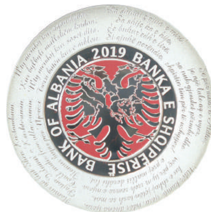
Sh. Në qendër harta e rajonit dhe Shqipëria e kuqe në zemër të shqiponjës dykrejtëshe. Shqiponja është ndarë sipas hartës. Mbi një platformë rrethore, qendron shkrimi "Banka e Shqipërisë", "Bank of Albania" "2019". Rreth medaljonit janë vargje të rilindësve që i këndojnë mallit, dashurisë për atdheun, gjuhës, flamurit dhe bashkimit pa dallim feje e krahine.