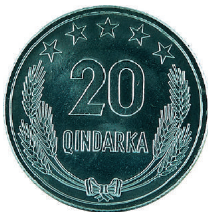
F. Në qendër vlera nominale; sipër në qendër 5 yje; poshtë kallinj gruri të lidhur me fjongo.