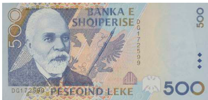
F. Ismail Qemali (1844-1919), udhëheqës i lëvizjes kombëtare dhe kryeministër i Shqipërisë së pavarur; shqiponja dhe pena. Sipër "BANKA E SHQIPERISE".