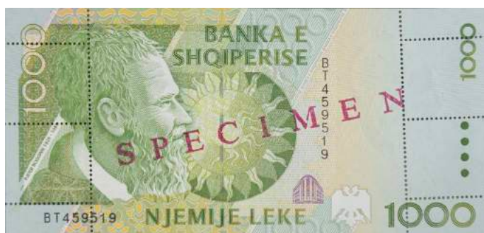
F. Pjetër Bogdani (1625-1689), autor i veprës së parë origjinale në gjuhën shqipe "Çeta e Profetëve"; një simbol i tij për diellin. Sipër "BANKA E SHQIPERISE".