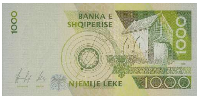
Sh. Sistem heliocentrik sipas Bogdanit; pamje e kishës së Vaut të Dejës. Sipër "BANKA E SHQIPERISE".