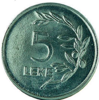
F. Vlera emërore dhe një degë ulliri anës vlerës.

Pesha: 3.120 g Diametri: 20 mm Materiali: çelik i veshur me nikel Ngjyra: e bardhë Forma: e sheshtë Hedhur në qarkullim 01.01.1997 Çmimi: 36 Lekë