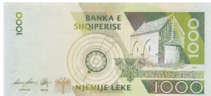
F. Pjetër Bogdani (1625-1689), autor i veprës së parë origjinale në gjuhën shqipe "Çeta e Profetëve"; një simbol i tij për diellin. Sipër "BANKA E SHQIPERISE".