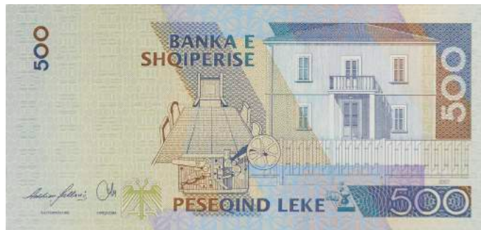
Sh. Ndërtesa ku u shpall Pavarësia, telegrafi me të cilin u përhap lajmi dhe dhoma ku u mor vendimi. Sipër "BANKA E SHQIPERISE".