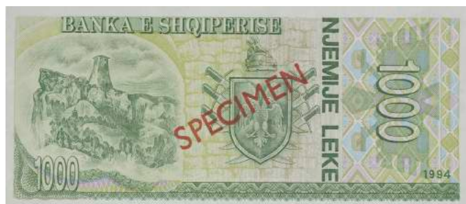
Sh. Në qendër emblema e Heroit Kombëtar, Gjergj Kastrioti Skënderbeut; majtas Kalaja e Krujës. Sipër "BANKA E SHQIPËRISË".