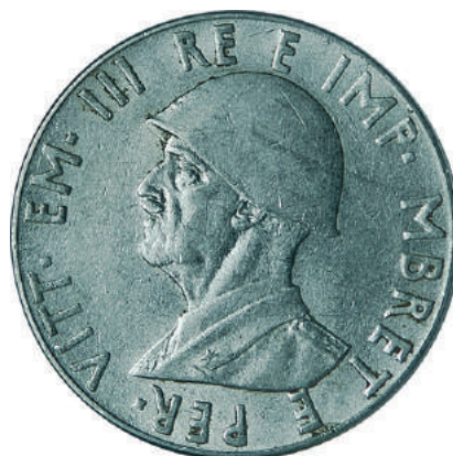
Sh. Bust me helmetë i Viktor Emanuelit III, majtas; mbishkrimi "VITT.EM.III.REE.IMP.MBRET.E.PER.".