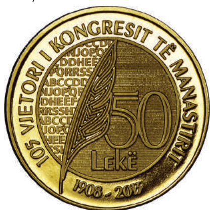
F. Alfabeti, penda dhe vlera emërore. Në hark “105-VJETORI I KONGRESIT TË MANASTIRIT” dhe “1908-2013”.