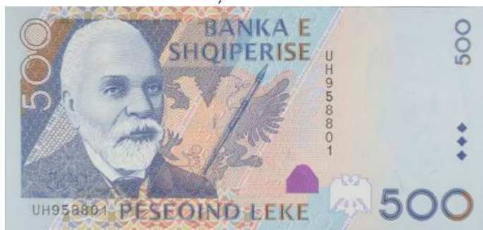
F. Ismail Qemali (1844-1919), udhëheqës i lëvizjes kombëtare dhe kryeministër i Shqipërisë së pavarur; shqiponja dhe pena. Sipër "BANKA E SHQIPERISE".