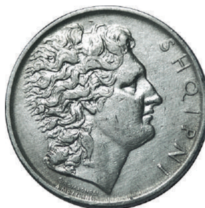
Sh. Profil klasik. Ka të shkruar anash "SHQIPNI".