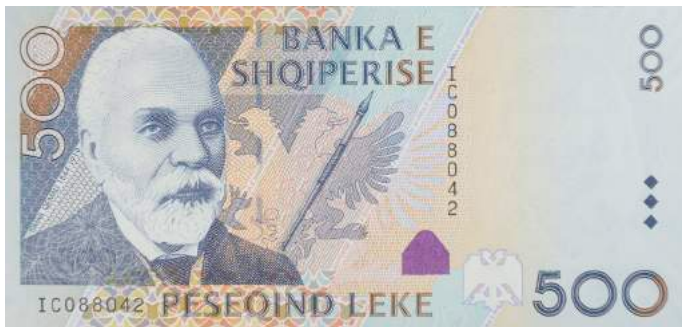
F. Ismail Qemali (1844-1919), udhëheqës i lëvizjes kombëtare dhe kryeministër i Shqipërisë së pavarur; shqiponja dhe pena. Sipër "BANKA E SHQIPERISE".