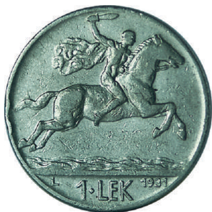
F. Alegori e heroit Skënderbe duke kalëruar. Poshtë ka vlerën "1 LEK" dhe vitin e shtypjes.