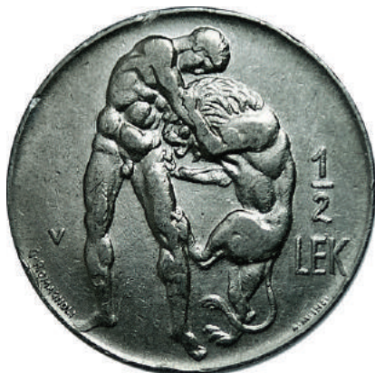
F. Herkuli duke u ndeshur me luanin e Nemeas; vlera "1/2 LEK" emrat e artistëve realizues.