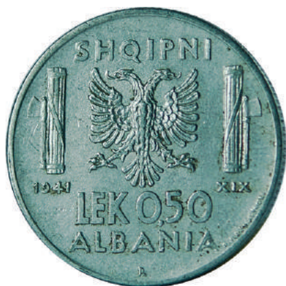
F. Shqiponja dykrenore mes dy "fascio"-ve (tufë shkopinjshtë të lidhur dhe një sëpatë), simbole të fashizmit; vitet "1941" "XIX" dhe vlera. Në hark "SHQIPNI" dhe "ALBANIA".

Materiali dhe pastërtia: Çelik Pesha: 6,00 g Përmasat: Ø 24.2 mm; thellësia e monedhës: 2 mm Emetuar nga: Banka Kombëtare e Shqipnis Shtypur në: Zecca di Roma, Mbretëria e Italisë Autorë: Skulptor Giuseppe Romagnoli Çmimi: 157.2 Lekë