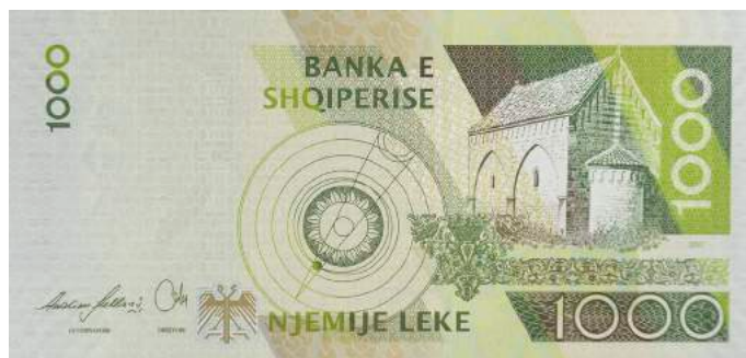
Sh. Sistem heliocentrik sipas Bogdanit; pamje e kishës së Vaut të Dejës. Sipër "BANKA E SHQIPERISE".