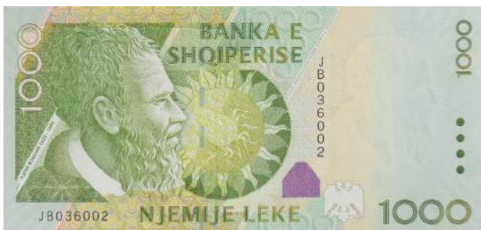
F. Pjetër Bogdani (1625-1689), autor i veprës së parë origjinale në gjuhën shqipe "Çeta e Profetëve"; një simbol i tij për diellin. Sipër "BANKA E SHQIPERISE".