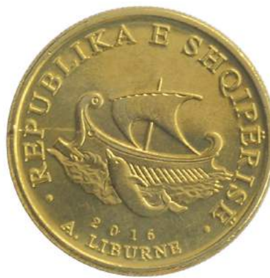
Sh. Në qendër anija liburne dhe një delfin. Në hark sipër "REPUBLIKA E SHQIPËRISË"; poshtë "2016".