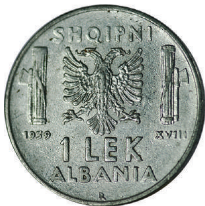
F. Shqiponja dykrenore mes dy "fascio"-ve (tufë shkopinjsh të lidhur dhe një sëpatë), simbole të fashizmit; vitet "1939" "XVIII" dhe vlera. Në hark "SHQIPNI" dhe "ALBANIA".

Materiali dhe pastërtia: Çelik Pesha: 8,00 g Përmasat: Ø 27 mm; thellësia e monedhës: 2.1 mm Emetuar nga: Banka Kombëtare e Shqipnis Shtypur në: Zecca di Roma, Mbretëria e Italisë Autorë: Skulptor Giuseppe Romagnoli Çmimi: 157.2 Lekë