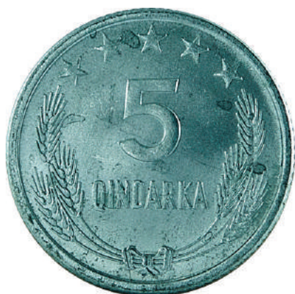
F. Në qendër vlera nominale; sipër në qendër 5 yje; poshtë kallinj gruri të lidhur me fjongo.