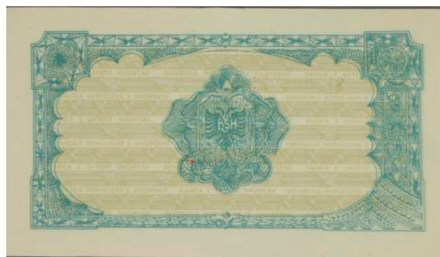
Sh. Në qendër shqiponja dykrenore me mbishkrimin "BANKA E SHTETIT SHQIPTAR".