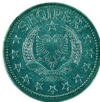
Sh. Stema e republikës në qendër, rrethuar në 3/4 me yje; shkruar në hark sipër "SHQIPËRI".