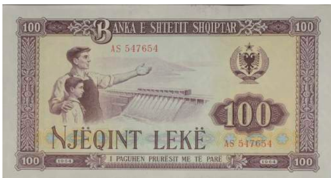
F. Punëtor dhe djalë i vogël përballë një hidrocentrali; djathtas stema e republikës, vlera nominale dhe viti i prodhimit. Sipër "BANKA E SHETIT SHQIPTAR"; poshtë "I PAGUHEN PRURËSIT ME TË PARË".