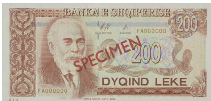
F. Majtas portreti i Ismail Qemalit; në qendër dhe djathtas vlera emërore. Sipër "BANKA E SHQIPËRISË".