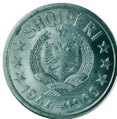
Sh. Stema e republikës e rrethuar me yje; në hark sipër shkrimi "SHQIPËRI" dhe poshtë vitet "1944-1969".