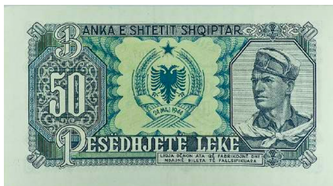
Sh. Vlera nominale; në qendër stema e republikës; majtas portreti i një ushtari. Sipër "BANKA E SHETIT SHQIPTAR"; poshtë shkrimi "LIGJA DËNON ATA QË FABRIKOJNË DHE NDAJNË BILETA TË FALSIFIKUARA".