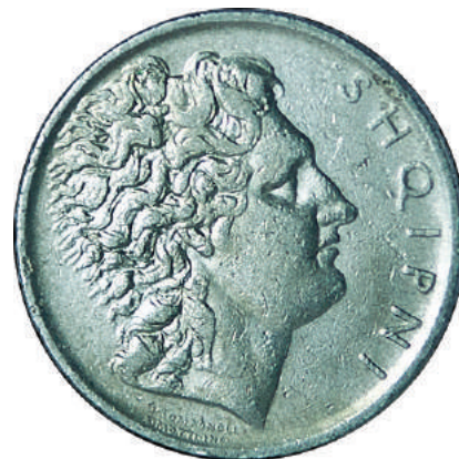
Sh. Fytyrë profili klasik. Ka të shkruar anash "SHQIPNI".