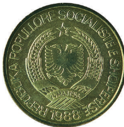
Sh. Stema e republikës; në hark sipër shkrimi "SHQIPËRI" dhe poshtë viti "1988".