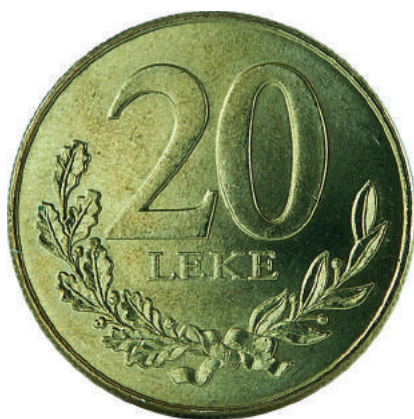
F. Vlera emërore dhe degë në formë kurore.