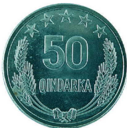
F. Në qendër vlera nominale; sipër në qendër 5 yje; poshtë kallinj gruri të lidhur me fjongo.