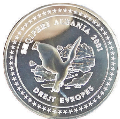
Sh. Në qendër një pëllumb. Në hark "Shqipëri Albania 2001" dhe "Drejt Evropës", e gjitha e rrethuar me yje.