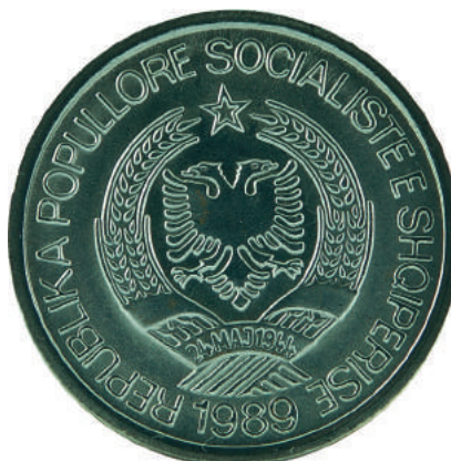
Sh. Në qendër stema e republikës; në hark "REPUBLIKA POPULLORE SOCIALISTE E SHQIPËRISE" dhe "1989".