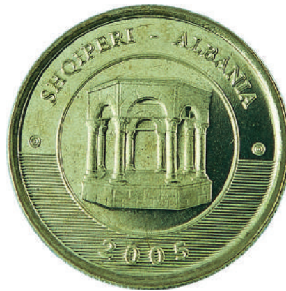
Sh. Në qendër objekti "Varr monumental i qytetit të Tiranës". Në hark "SHQIPËRI - ALBANIA" dhe viti "2005".