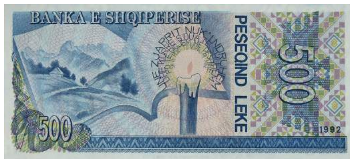
Sh. Në qendër një qiri me përreth disa vargje të poetit Naim Frashëri. Sipër "BANKA E SHQIPËRISE".