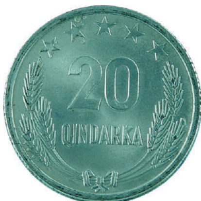
F. Në qendër vlera nominale; sipër në qendër 5 yje; poshtë kallinj gruri të lidhur me fjongo.