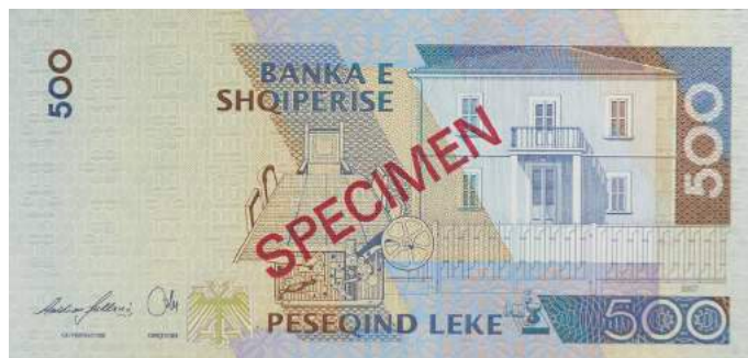
Sh. Ndërtesa ku u shpall Pavarësia, telegrafi me të cilin u përhap lajmi dhe dhoma ku u mor vendimi. Sipër "BANKA E SHQIPERISE".