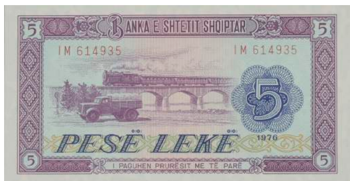
F. Në qendër kamion dhe tren mbi urë me tre harqe; djathtas vlera nominale dhe viti i emetimit. Sipër "BANKA E SHTETIT SHQIPTAR"; poshtë "I PAGUHEN PRURËSIT ME TË PARË".