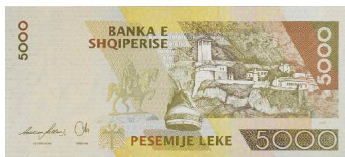
F. Heroi kombëtar, Gjergj Kastriotit Skënderbeut (1405-1468); shqijponja dykrenore, mburoja e shpata e tij. Sipër "BANKA E SHQIPERISE".