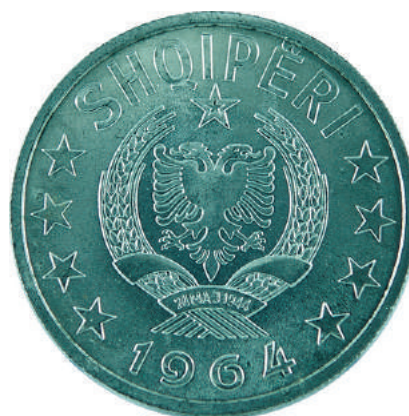
Sh. Në qendër stema e republikës; sipër "SHQIPËRI"; poshtë viti i emetimit "1964".