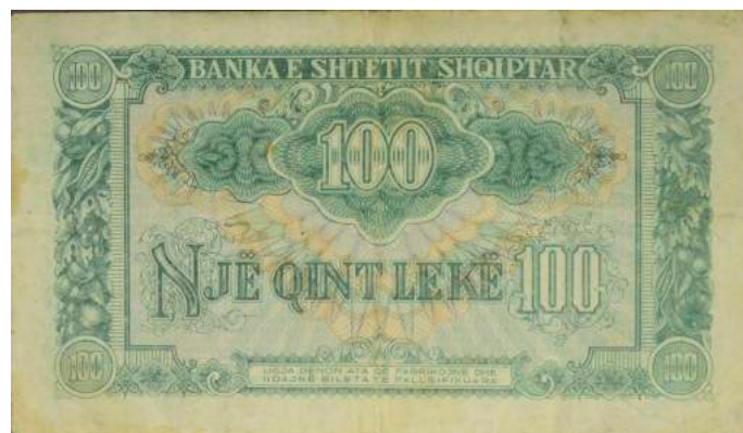
Sh. Në qendër vlera me shifra dhe me shkronja. Sipër "BANKA E SHTETIT SHQIPTAR"; poshtë "LIGJA DËNON ATA QË FABRIKOJNË DHE NDAJNË BILETA TË FALSIFIKUARA".