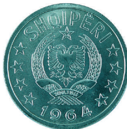
Sh. Në qendër stema e republikës; sipër "SHQIPËRI"; poshtë viti i emetimit "1964".