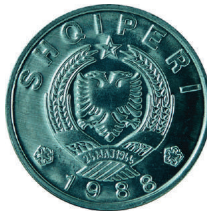
Sh. Stema e republikës; në hark sipër shkrimi "SHQIPËRI" dhe poshtë viti "1988".