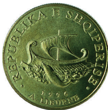
Sh. Në qendër anija liburne dhe poshtë një delfin. Në hark sipër "REPUBLIKA E SHQIPERISE"; poshtë "1996".