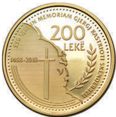
F. Profil i Gjergj Kastrioti Skënderbeut, djathtas në formë siluete, shpata e heroit, në sfond, një degë ulliri si simbol i lavdisë. Shkrimet "200 LEKË" dhe "550 VJET IN MEMORIAM GJERGJ KASTRIOTI SKËNDERBEUT 1468 – 2018".

Materiali dhe pastërtia: Au, 900/1000 Pesha: 15,50 g Diametri: 25,45 mm Forma: e dhëmbëzuar Tirazhi: 500 copë Autori: Petraq Papa Shtypur në: Mint of Finland Çmimi: 145647.6 Lekë