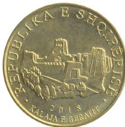
Sh. Në qendër Kalaja e Beratit. Në hark "Republika e Shqipërisë" dhe "2018".