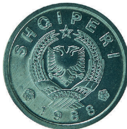
Sh. Stema e republikës; në hark sipër shkrimi "SHQIPËRI" dhe poshtë viti "1988".