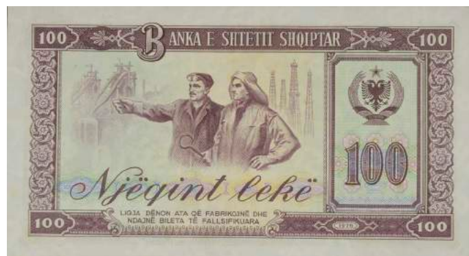
Sh. Metalurg dhe naftëtar, në sfond Kombinati Metalurgjik. Djathtas stema e republikës, vlera dhe viti i shtypjes. Sipër "BANKA E SHETIT SHQIPTAR"; poshtë "LIGJA DËNON ATA QË FABRIKOJNË DHE NDAJNË BILETA TË FALSIFIKUARA".