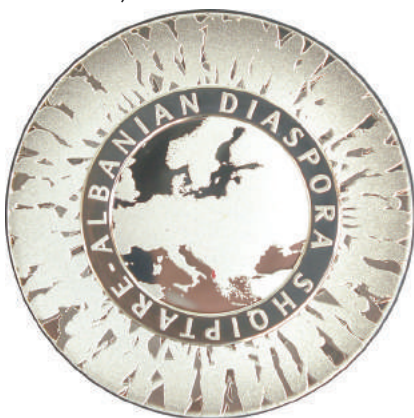
F. Silueta njerëzish në ecje, në ritëm të përsëritur në lëvizje të vazhdueshme rreth globit, ku jepet idea e largimit nga atdheu. Mbi një platformë rrethore, qendron shkrimi "ALBANIAN DIASPORA SHQIPTARE". Në qendër është harta e Evropës, ku Shqipëria është evidencuar me të kuqe.

Materiali: Ag, 925/1000 Pesha: 30 g Diametri: 40 mm Forma: e rumbullakët Tirazhi: 500 copë Autori: Brikena Berdo. Shtypur nga: Mint of Finland Çmimi: 9510 Lekë