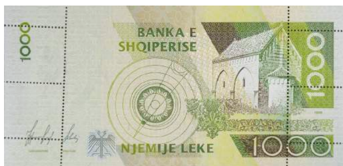
Sh. Sistem heliocentrik sipas Bogdanit; pamje e kishës së Vaut të Dejës. Sipër "BANKA E SHQIPERISE".