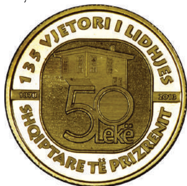
F. Shtëpia muze e Kuvendit të Lidhjes Shqiptare të Prizrenit; vlera emërore. Sipër "1878" dhe "2013". Përqark "135-VJETORI I LIDHJES SHQIPTARE TË PRIZRENIT".