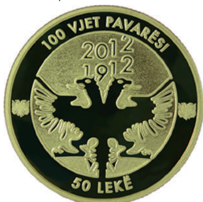
F. Shqiponja dykrenore e flamurit të ngritur në Vlorë; vitet 1912-2012. Në hark “100 VJET PAVARËSI” dhe vlera emërore.