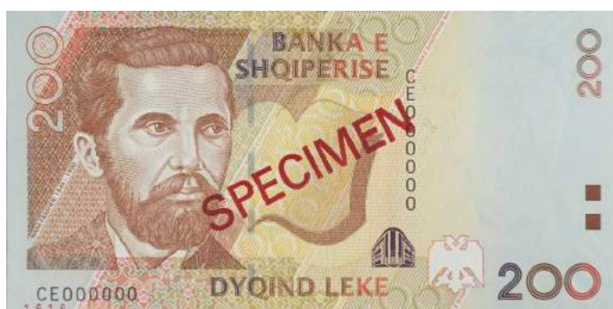
F. Naim Frashëri (1846-1900), shkrimtari i shquar i Rilindjes Kombëtare dhe një libër i hapur. Sipër "BANKA E SHQIPERISE".