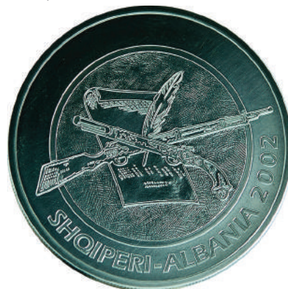
Sh. Në qendër një libër mbi të një pushkë dhe një penë. Në hark poshtë “Shqipëri - Albania 2002”.