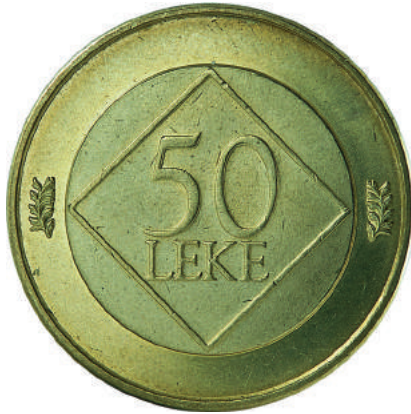
F. Në qendër vlera e vendosur brenda një rombi.

Materiali dhe pastërtia: CuAl5Zn5Sn1 Peshë: 12 g Diametri: 28 mm Ngjyra: e verdhë Tirazhi: 20000 copë Autori: piktori Petraq Papa Shtypur në: "Kremnica Mint", Sllovaki Çmimi: 391.2 Lekë