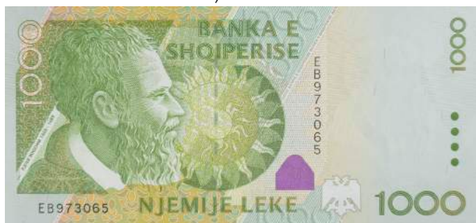
F. Pjetër Bogdani (1625-1689), autor i veprës së parë origjinale në gjuhën shqipe "Çeta e Profetëve"; një simbol i tij për diellin. Sipër "BANKA E SHQIPERISE".