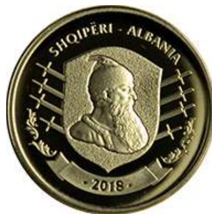
Sh. Kompozim i simbolit të Kuvendit të Lezhës, me profilin e Gjergj Kastrioti Skënderbeut, kthyer djathtas. Në secilën anë të emblemës janë vendosur katër shpata si simbol i bashkimit. Elemente floreale, të bashkuara nga një fjongo. Shkrimet: "2018" dhe "SHQIPËRI - ALBANIA".