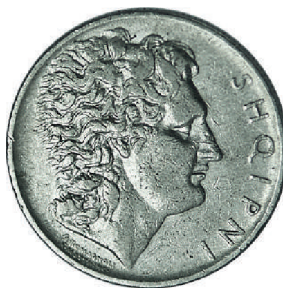
Sh. Profil klasik. Ka të shkruar anash "SHQIPNI".