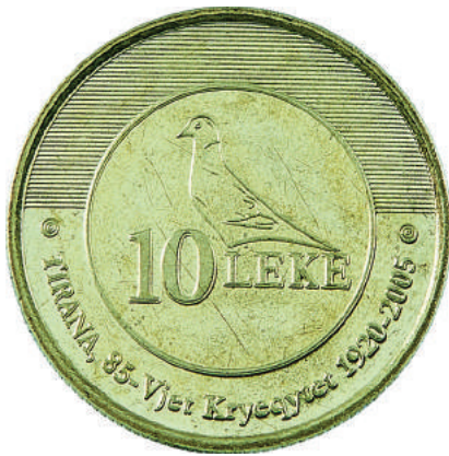
F. Vlera emërore, sipër një pëllumb. Në hark "Tirana 85-vjet kryeqytet" dhe vitet "1920-2005".