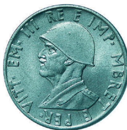
Sh. Bust me helmetë i Viktor Emanuelit III, majtas; mbishkrimi "VITT. EM. III. REE. IMP. MBRET. E. PER. ".