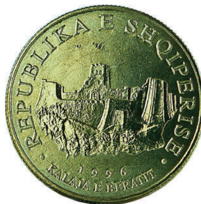
Sh. Në qendër Kalaja e Beratit. Në hark sipër "REPUBLIKA E SHQIPERISE"; poshtë "1996".