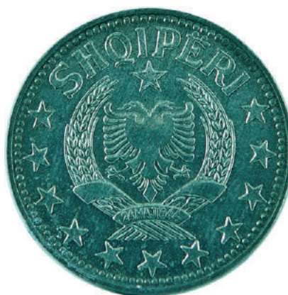
Sh. Stema e republikës në qendër, rrethuar në 3/4 me yje; shkruar në hark sipër "SHQIPËRI".