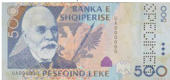
F. Ismail Qemali (1844-1919), udhëheqës i lëvizjes kombëtare dhe kryeministër i Shqipërisë së pavarur; shqiponja dhe pena. Sipër "BANKA E SHQIPERISE".