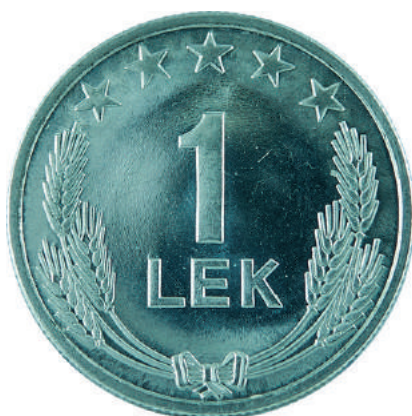
F. Në qendër vlera nominale; sipër në qendër 5 yje; poshtë kallinj gruri të lidhur me fjongo.