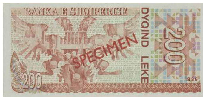
Sh. Në qendër një shqiponjë dhe ndërtesa ku u shpall Pavarësia e Shqipërisë. Sipër "BANKA E SHQIPËRISË".