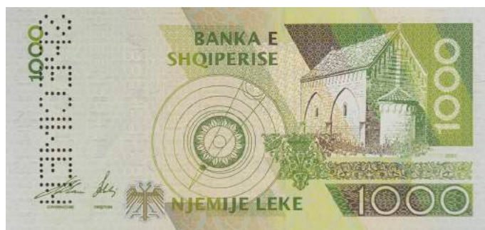
Sh. Sistem heliocentrik sipas Bogdanit; pamje e kishës së Vaut të Dejës. Sipër "BANKA E SHQIPERISE".