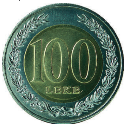
F. Vlera emërore dhe degë në formë kurore.