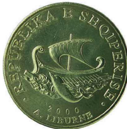
Sh. Në qendër anija liburne dhe një delfin. Në hark sipër "REPUBLIKA E SHQIPERISE"; poshtë "2000".