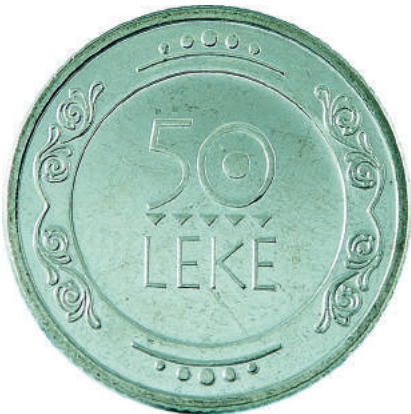
F. Dekoracione të stilizuara të etnografisë shqiptare. Në hark poshtë "SHQIPËRI - ALBANIA 2004".

Materiali dhe pastërtia: Cu75 Ni25 Peshë: 5,50 g Diametri: 24,25 mm Forma: e dhëmbëzuar Tirazhi: 200000 copë Ngjyra: e bardhë Autori: piktori Artan Peqini Shtypur në: Polish State Mint (Mennica Państwowa SA), Poloni Çmimi: 391.2 Lekë