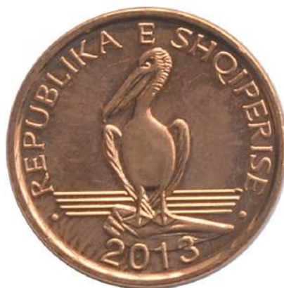
Sh. Në qendër pelikani kaçurrel ( Pelecanus crispus ), specie e rrallë e lagunës së Karavastasë. Në hark sipër "REPUBLIKA E SHQIPERISE"; poshtë "2013".