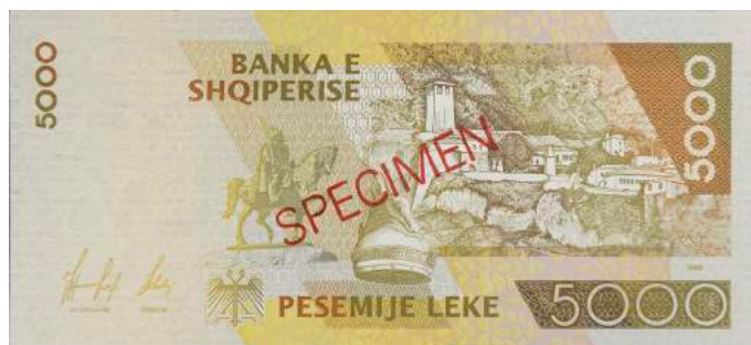
F. Heroi kombëtar, Gjergj Kastriotit Skënderbeut (1405-1468); shqiponja dykrenore, mburoja e shpata e tij. Sipër "BANKA E SHQIPERISE".