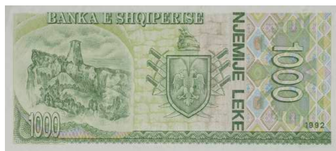
Sh. Në qendër emblema e Heroit Kombëtar, Gjergj Kastrioti Skënderbeut; majtas Kalaja e Krujës. Sipër "BANKA E SHQIPËRISE".