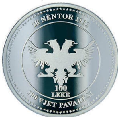
F. Shqiponja dykrenore e flamurit të ngritur në Vlorë; nën të vlera emërore. Në hark “28 Nëntor 1912” dhe “100 VJET PAVARËSI”. Përqark 100 yje.

Materiali dhe pastërtia: Argjend, 925/1000 Peshë: 30 g Diametri: 38 mm Forma: e dhëmbëzuar Tirazhi: 1.000 copë Autori: piktori Orgest Tafa Shtypur në: SUNSHINE MINTING, INC., SH.B.A Çmimi i kësaj monedhe rishikohet çdo fillim muaji. https://www.bankofalbania.org/Muzeu_dhe_Edukimi/Muzeu_i_Bankes_se_Shqiperise/Dyqani_i_Muzeut_te_Bankes_se_Shqiperise/