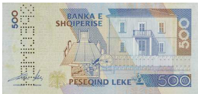
Sh. Ndërtesa ku u shpall Pavarësia, telegrafi me të cilin u përhap lajmi dhe dhoma ku u mor vendimi. Sipër "BANKA E SHQIPERISE".