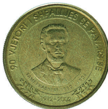
Sh. Vlera emërore. Në hark “90-Vjetori i Shpalljes së Pavarësisë” dhe “2002”.