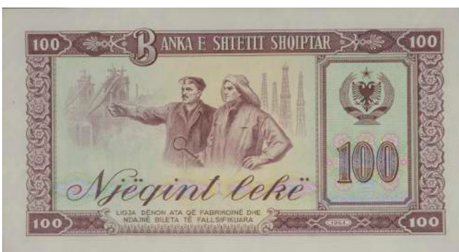
Sh. Metalurg dhe naftëtar, në sfond Kombinati Metalurgjik. Djathtas stema e republikës, vlera dhe viti i shtypjes. Sipër "BANKA E SHETIT SHQIPTAR"; poshtë "LIGJA DËNON ATA QË FABRIKOJNË DHE NDAJNË BILETA TË FALSIFIKUARA".