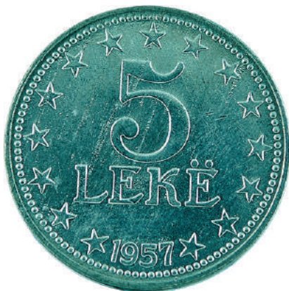
F. Vlera në qendër me yje përreth; në hark poshtë viti i shtypjes "1957".