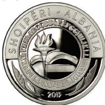
Sh. Një pishtar mbi alfabet; përreth gjerat e alfabetit. Në hark, penda si dekor; “SHQIPËRI-ALBANIA” dhe “2013”.