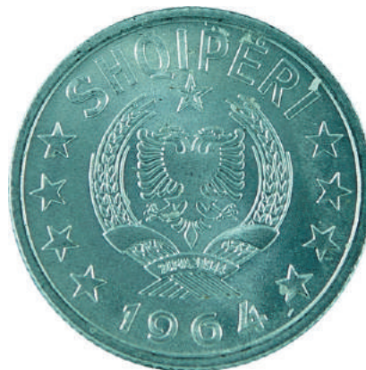
Sh. Në qendër stema e republikës; sipër "SHQIPËRI"; poshtë viti i emetimit "1964".