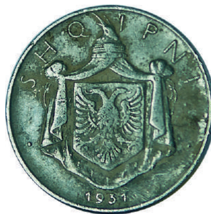
Sh. Stema mbretërore në qendër, shkrimi "SHQIPNI" përreth dhe viti i shtypjes në hark poshtë.