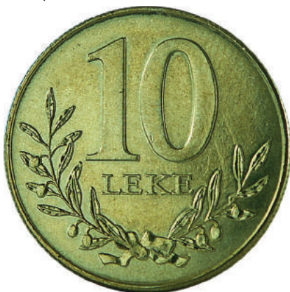
F. Vlera emërore dhe degë në formë kurore.

Pesha: 3.600 g Diametri: 21.25 mm Materiali: përzierje bakër-nikel-alumin Ngjyra: e verdhë Forma: e dhëmbëzuar Hedhur në qarkullim: 01.01.1997 Çmimi: 36 Lekë