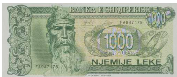
F. Majtas portreti i Heroit Kombëtar, Gjergj Kastrioti-Skënderbeu. Poshtë vlera emërore dhe lart "BANKA E SHQIPËRISË".