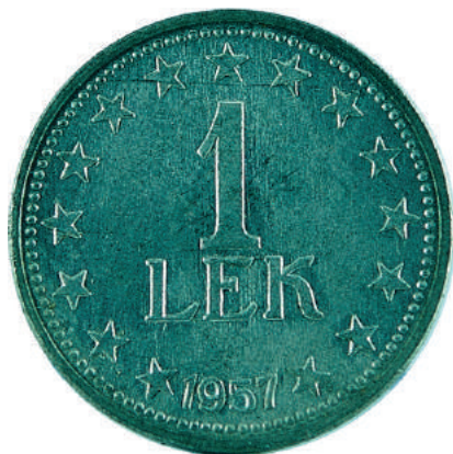
F. Vlera në qendër me yje përreth; në hark poshtë viti i shtypjes "1957".