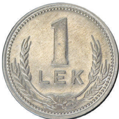
F. Në qendër vlera nominale; poshtë kallinj gruri të lidhur me fjongo.