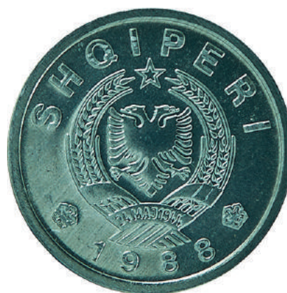
Sh. Stema e republikës; në hark sipër shkrimi "SHQIPËRI" dhe poshtë viti "1988".