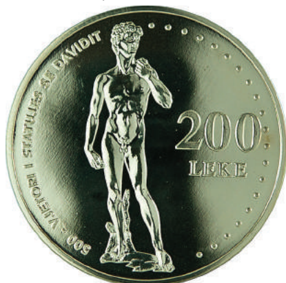
F. Kompozim i statujës së Davidit, vlera e monedhës. Mbishkrimi "500-vjetori i statujës së Davidit".

https://www.bankofalbania.org/Muzeu_dhe_Edukimi/Muzeu_i_Bankes_se_Shqiperise/Dyqani_i_Muzeut_te_Bankes_se_Shqiperise/