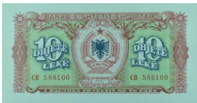
F. Në qendër stema e republikës dhe viti i shtypjes; në dy anët, vlera nominale. Sipër "BANKA E SHETIT SHQIPTAR"; poshtë "I PAGUHEN PRURËSIT ME TË PARË".