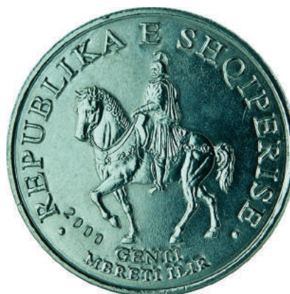
Sh. Në qendër mbreti ilir Gent mbi kalë. Në hark sipër "REPUBLIKA E SHQIPERISE"; poshtë "2000".