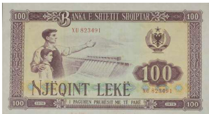
F. Punëtor dhe djalë i vogël përballë një hidrocentrali; djathtas stema e republikës, vlera nominale dhe viti i prodhimit. Sipër "BANKA E SHETIT SHQIPTAR"; poshtë "I PAGUHET PRURËSIT ME TË PARË".