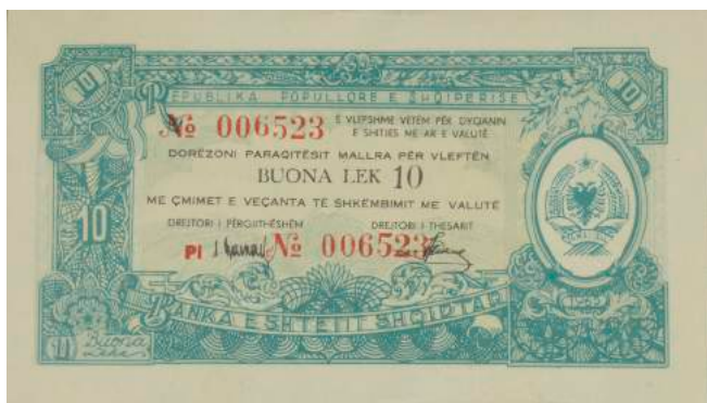
F. Vlera nominale; në të djathtë stema e republikës. Sipër "REPUBLIKA POPULLORE E SHQIPËRISË"; poshtë "BANKA E SHTETIT SHQIPTAR".

Viti i emetimit: 1965 Emetuar nga: Ministria e Financave (sasi e limituar) Përmasat: 117 x 66 mm Shtypur në: Shqipëri Ngjyra: E gjelbër Çmimi: 15536.4 Lekë