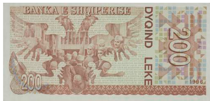
Sh. Në qendër një shqiponjë dhe ndërtesa ku u shpall Pavarësia e Shqipërisë. Sipër "BANKA E SHQIPËRISË".