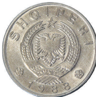
Sh. Stema e republikës; në hark sipër shkrimi "SHQIPËRI" dhe poshtë viti "1988".