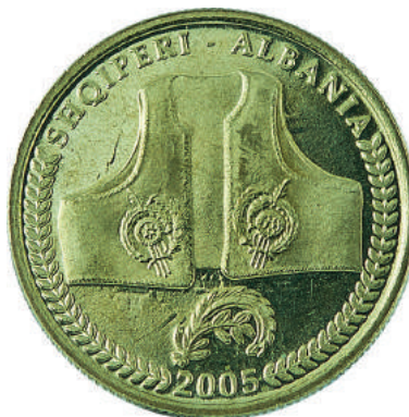
Sh. Në qendër një jelek, veshje popullore. Në hark «SHQIPËRI - ALBANIA» dhe viti "2005".