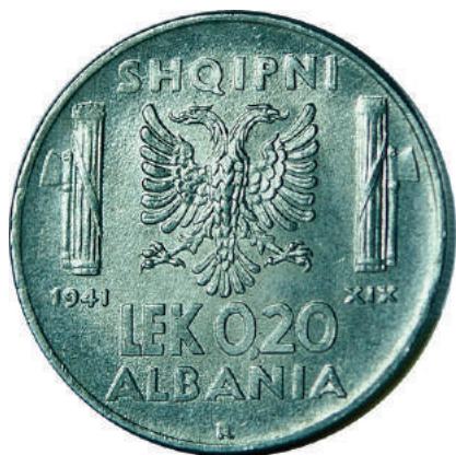
F. Shqiponja dykrenore mes dy "fascio"-ve të Liktorit (tufë shkopinësh të lidhur dhe një sëpatë), simbole të fashizmit; vitet "1941" "XIX" dhe vlera. Në hark "SHQIPNI" dhe "ALBANIA".

Materiali dhe pastërtia: Çelik Pesha: 4,00 g Përmasat: Ø 21.7 mm; thellësia e monedhës: 1.7 mm Emetuar nga: Banka Kombëtare e Shqipnis Shtypur në: Zecca di Roma, Mbretëria e Italisë Autorë: Skulptor Giuseppe Romagnoli Çmimi: 104.4 Lekë