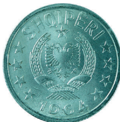
Sh. Në qendër stema e republikës; sipër "SHQIPËRI"; poshtë viti i emetimit "1964".