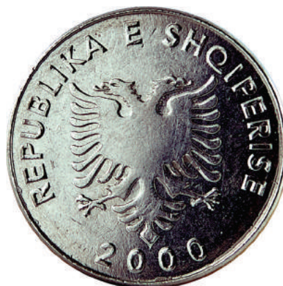
Sh. Në qendër shqiponja e flamurit. Në hark sipër "REPUBLIKA E SHQIPERISE"; poshtë "2000".