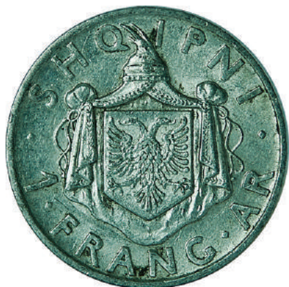
F. Stema mbretërore në qendër; shkruar në hark "1 FRANG AR. SHQIPNI".

Çmimi përditësohet çdo muaj sipas kursit të arit dhe argjendit. Për çmimet e përditësuar ju lutem vizitoni https://www.bankofalbania.org/Muzeu_dhe_Edukimi/Muzeu_i_Bankes_se_Shqiperise/Dyqani/