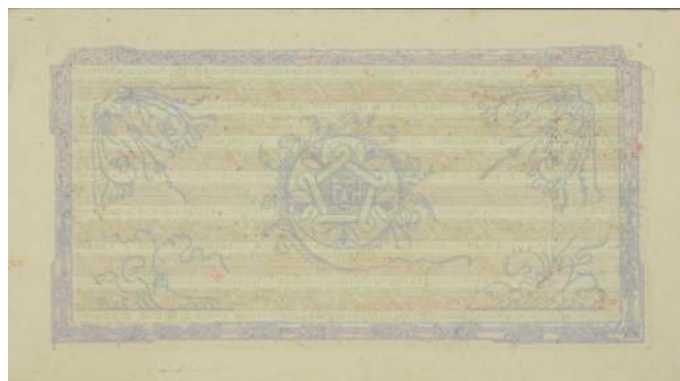
F. Vlera nominale; në të djathtë stema e republikës. Sipër "REPUBLIKA POPULLORE E SHQIPËRISË"; poshtë "BANKA E SHQIPTAR".