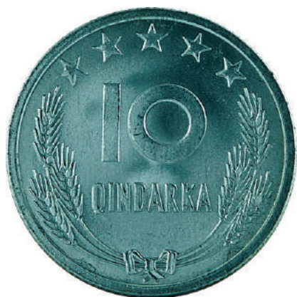
F. Në qendër vlera nominale; sipër në qendër 5 yje; poshtë kallinj gruri të lidhur me fjongo.