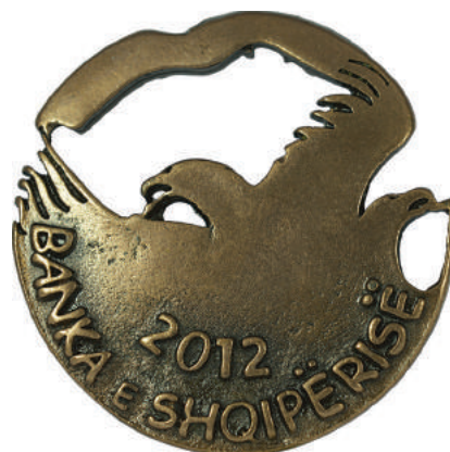
Sh. Shqiponjë e stilizuar. Poshtë viti "2012" dhe "BANKA E SHQIPËRISË"