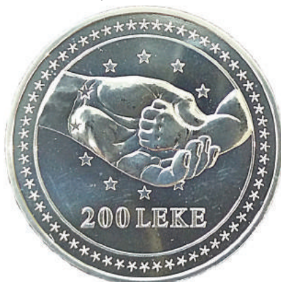
F. Dy duar, njëra e një të rrituri dhe tjetra e një fëmije, shoqëruar me yjet e Bashkimit Europian; vlera emërore.

https://www.bankofalbania.org/Muzeu_dhe_Edukimi/Muzeu_i_Bankes_se_Shqiperise/Dyqani_i_Muzeut_te_Bankes_se_Shqiperise/