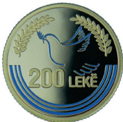
F. Në qendër një pëllumb në fluturim; vlera emërore. Në hark dy degë ulliri, si simbol i paqes.

https://www.bankofalbania.org/Muzeu_dhe_Edukimi/Muzeu_i_Bankes_se_Shqiperise/Dyqani_i_Muzeut_te_Bankes_se_Shqiperise/