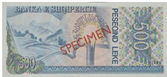
Sh. Në qendër një qiri me përreth disa vargje të poetit Naim Frashëri. Sipër "BANKA E SHQIPËRISË".