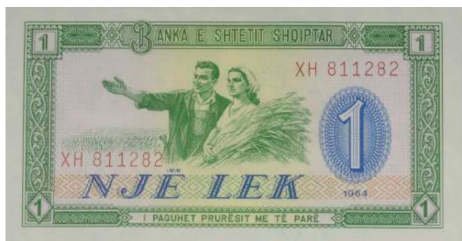
F. Në qendër çift fshatarësh; djathtas vlera nominale dhe viti i emetimit. Sipër "BANKA E SHETIT SHQIPTAR"; poshtë "I PAGUHET PRURËSIT ME TË PARË".