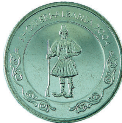
Sh. Burrë me kostumin tradicional, fustanellën, me në dorë pushkën shqiptare, njohur si "Le long fusil albanais".