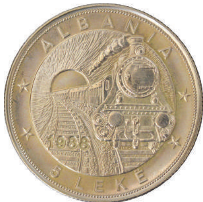
F. Në qendër treni me avull duke dalë nga tuneli; poshtë vlera "5 LEKË"; sipër "ALBANIA".

Materiali dhe pastërtia: Bakër/Nikel Pesha: 28.2 g Përmasat: Ø 38.7 mm; thellësia e monedhës 3.4 mm Emetuar nga: Banka e Shtetit Shqiptar Shtypur në: Coin Invest Trust Vaduz, Zyrih, Zvicër Çmimi: 1664.4 Lekë