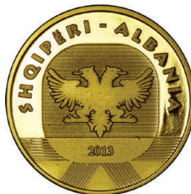
Sh. Shqiponja e Kastriotëve; poshtë një shqiponjë e stilizuar. Në hark "SHQIPËRI-ALBANIA" dhe viti "2013".