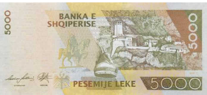
F. Heroi kombëtar, Gjergj Kastriotit Skënderbeut (1405-1468); shqijponja dykrenore, mburoja e shpata e tij. Sipër "BANKA E SHQIPERISE".