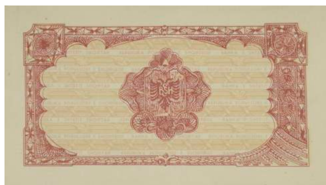
Sh. Në qendër shqiponjan dykrenore me mbishkrimin "BANKA E SHTETIT SHQIPTAR".