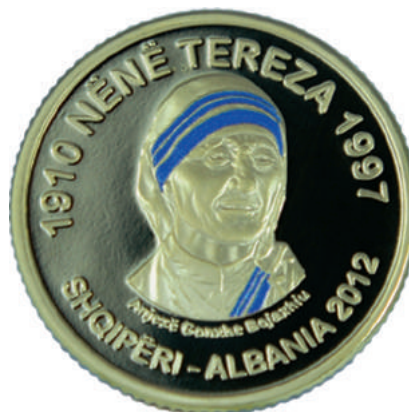
Sh. Portreti i Nënë Terezës. Në hark "NËNË TEREZA"; vitet e lindjes dhe vdekjes; "Anjezë Gonxhe Bojaxhiu" dhe "SHQIPËRI - ALBANIA 2012".