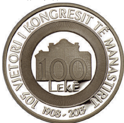
F. Shtëpia muze e Kongresit të Manastirit, vlera emërore. Në hark “105-VJETORI I KONGRESIT TË MANASTIRIT” dhe “1908-2013”.

https://www.bankofalbania.org/Muzeu_dhe_Edukimi/Muzeu_i_Bankes_se_Shqiperise/Dyqani_i_Muzeut_te_Bankes_se_Shqiperise/