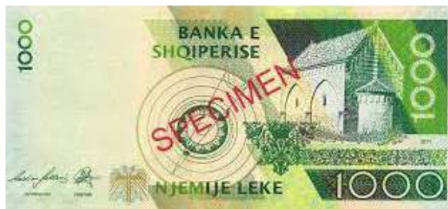
Sh. Sistem heliocentrik sipas Bogdanit; pamje e kishës së Vaut të Dejës. Sipër "BANKA E SHQIPERISE".