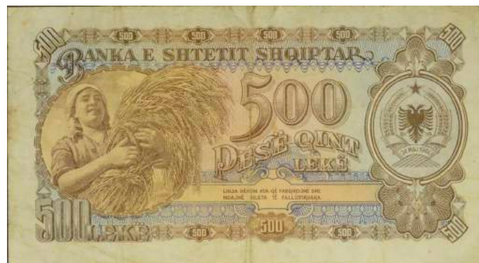
Sh. Djathtas stema e republikës; majtas një grua me kalli gruri; në qendër vlera nominale. Sipër "BANKA E SHTETIT SHQIPTAR"; poshtë "LIGJA DËNON ATA QË FABRIKOJNË DHE NDAJNË BILETA TË FALSIFIKUARA".