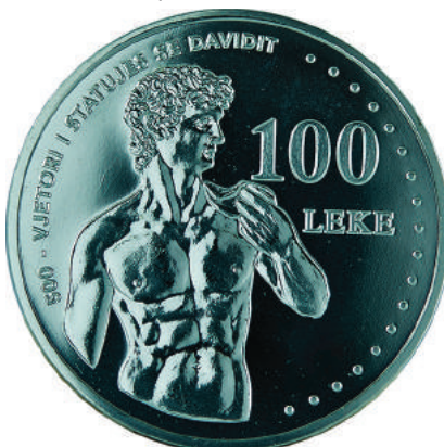
F. Kompozim i Statujës së Davidit; vlera e monedhës. Në hark sipër «500-vjetori i statujës së Davidit».

https://www.bankofalbania.org/Muzeu_dhe_Edukimi/Muzeu_i_Bankes_se_Shqiperise/Dyqani_i_Muzeut_te_Bankes_se_Shqiperise/