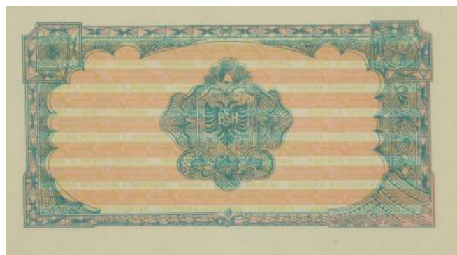
F. Vlera nominale; në të djathtë stema e republikës. Sipër "REPUBLIKA POPULLORE E SHQIPËRISË"; poshtë "BANKA E SHQIPTAR".