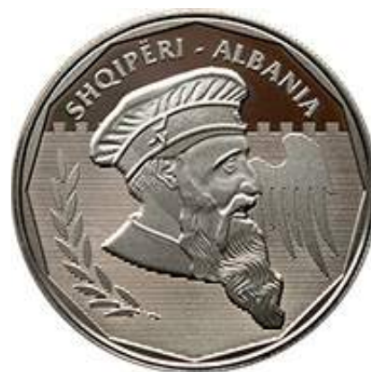
Sh. Profil i Gjergj Kastrioti Skënderbeut, kthyer djathtas; njëri krah i shqiponjës së emblemës së Kastriotëve; një degë ulliri me gjethe; Kalaja e Lezhës në alto relief. Shkrimet "SHQIPËRI - ALBANIA".