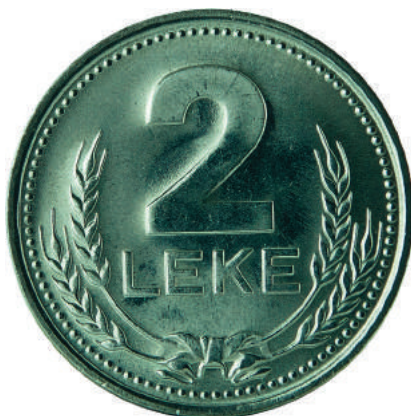
F. Në qendër vlera nominale "2 LEKË", rrethuar me kallinj gruri të lidhur me fjongo.