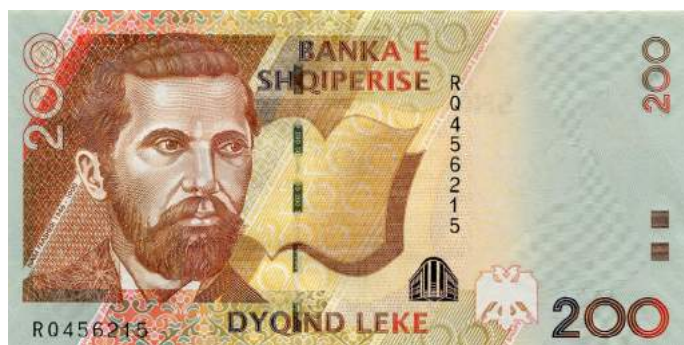
F. Naim Frashëri (1846-1900), shkrimtari i shquar i Rilindjes Kombëtare dhe një libër i hapur. Sipër "BANKA E SHQIPERISE".