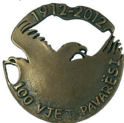
F. Shqiponjë e stilizuar me shirit ku shkruhen vitet "1912-2012". Poshtë "100 VJET PAVARËSI".