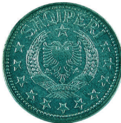
Sh. Stema e republikës në qendër, rrethuar në 3/4 me yje; shkruar në hark sipër "SHQIPËRI".