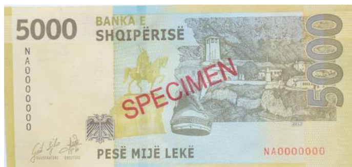
F. Heroi kombëtar, Gjergj Kastriotit Skënderbeut (1405-1468); shqiponja dykrenore, mburoja e shpata e tij. Sipër "BANKA E SHQIPËRISË".