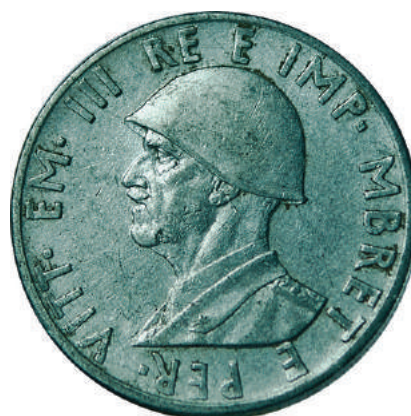
Sh. Bust me helm të i Viktor Emanuelit III, majtas; mbishkrimi "VITT. EM. III. REE. IMP. MBRET. E PER.".