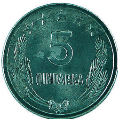
F. Në qendër vlera nominale; sipër në qendër 5 yje; poshtë kallinj gruri të lidhur me fjongo.