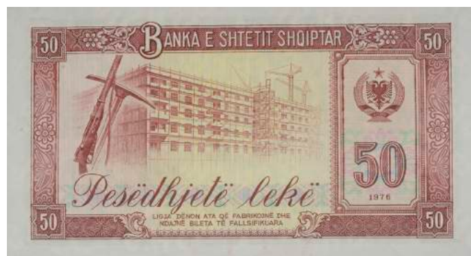
Sh. Pushkë, kazmë dhe pallat i papërfunduar. Djathtas stema e republikës, vlera dhe viti i shtypjes. Sipër "BANKA E SHETIT SHQIPTAR"; poshtë "LIGJA DËNON ATA QË FABRIKOJNË DHE NDAJNË BILETA TË FALSIFIKUARA".