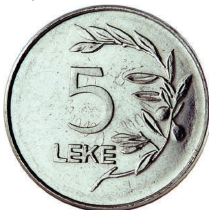
F. Vlera emërore dhe një degë ulliri anës vlerës.