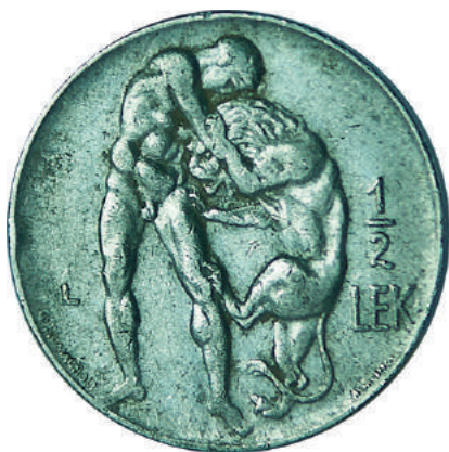
F. Herkuli duke u ndeshur me luanin e Nemeas; vlera "1/2 LEK" emrat e artistëve realizues.

Materiali dhe pastërtia: Nikel Pesha: 6,00 g Përmasat: Ø 24 mm; thellësia e monedhës: 2.1 mm Emetuar nga: Banka Kombëtare e Shqipnis Shtypur në: Londër, Mbretëri e Bashkuar Autorë: Skulptor Giuseppe Romagnoli dhe gdhendës Attilio Motti Çmimi: 313.2 Lekë