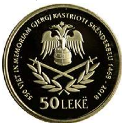
F. Shqiponja e emblemës së Kastriotëve; përkrenarja e Gjergj Kastrioti Skënderbeut; dy shpata të kryqëzuara; si dhe dy degë ulliri, si simbol i lavdisë. Shkrimet: "50 LEKË" dhe "550 VJET IN MEMORIAM GJERGJ KASTRIOTI SKËNDERBEU 1468-2018".