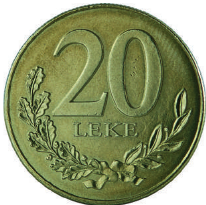
F. Vlera emërore dhe degë në formë kurore.