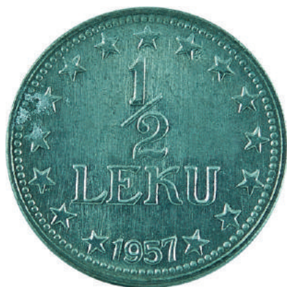
F. Vlera në qendër me yje përreth; në hark poshtë viti i shtypjes "1957".

Materiali dhe pastërtia: Zink Pesha: 2,10 g Përmasat: Ø 18.3 mm; thellësia e monedhës 1.5 mm Emetuar nga: Banka e Shtetit Shqiptar Shtypur në: Bashkimin Sovjetik Autori: Kel Kodheli Çmimi: 39.6 Lekë