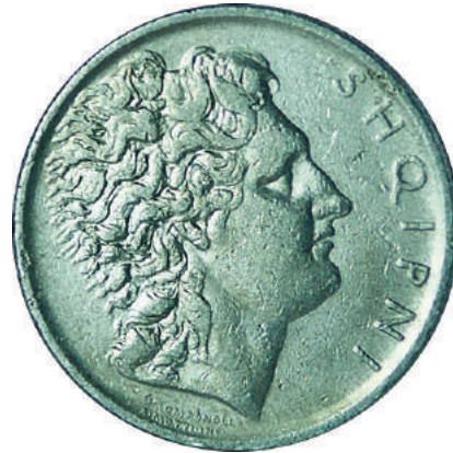
Sh. Profil klasik. Ka të shkruar anash "SHQIPNI".