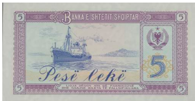
Sh. Në qendër anije e flotës tregtare; djathtas stema e republikës dhe vlera nominale. Sipër "BANKA E SHTETIT SHQIPTAR"; poshtë "LIGJA DËNON ATA QË FABRIKOJNË DHE NDAJNË BILETA TË FALSIFIKUARA".