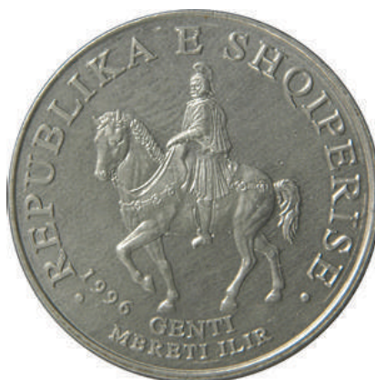
Sh. Në qendër mbreti ilir Gent mbi kalë. Në hark sipër "REPUBLIKA E SHQIPERISE"; poshtë "1996".