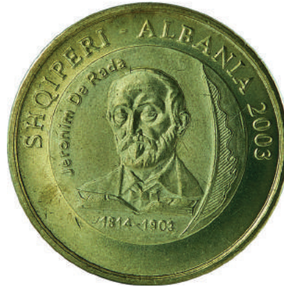
Sh. Në qendër Jeronim De Rada; një libër i hapur; poshtë (1814-1903). Djathtas emri dhe majtas penda; sipër "Shqipëri - Albania 2003".