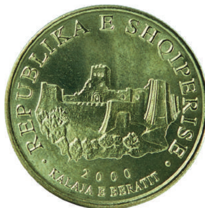
Sh. Në qendër Kalaja e Beratit. Në hark sipër "REPUBLIKA E SHQIPERISE"; poshtë "2000".