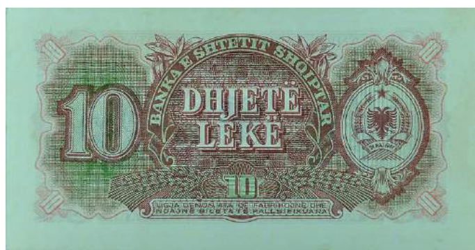
Sh. Vlera nominale në qendër dhe majtas; në të djathtë stema e republikës. Sipër "BANKA E SHETIT SHQIPTAR"; poshtë shkrimi "LIGJA DËNON ATA QË FABRIKOJNË DHE NDAJNË BILETA TË FALSIFIKUARA".