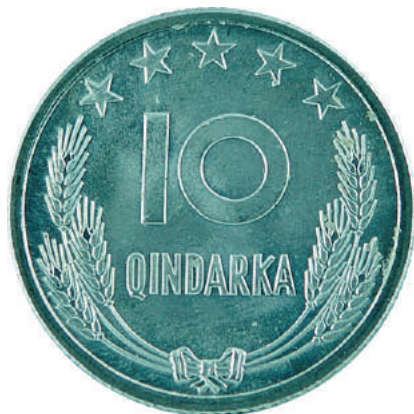
F. Në qendër vlera nominale; sipër në qendër 5 yje; poshtë kallinj gruri të lidhur me fjongo.