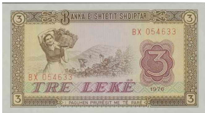
F. Majtas grua me shportë me rrush në sfond me vreshta; djathtas vlera nominale dhe poshtë viti i shtypjes. Sipër "BANKA E SHTETIT SHQIPTAR"; poshtë "I PAGUHEN PRURËSIT ME TË PARË".