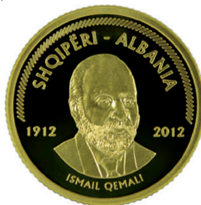
Sh. Portreti i Ismail Qemalit dhe emri i tij; vitet "1912 dhe 2012". Sipër "SHQIPËRI - ALBANIA" dhe xhufkat (thekët) që rrethojnë flamurin.