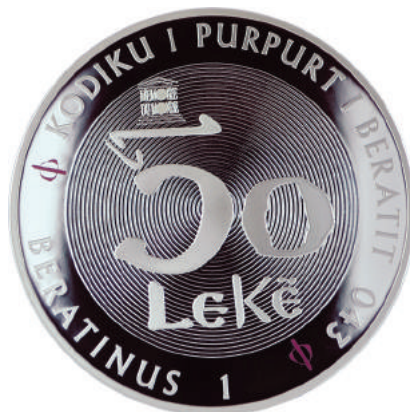
F. Vlera emërore; logo e UNESCO-s mbi numrin "5". Përreth "Kodiku i Purpurit i Beratit 043 Ø - Beratinus 1".

https://www.bankofalbania.org/Muzeu_dhe_Edukimi/Muzeu_i_Bankes_se_Shqiperise/Dyqani_i_Muzeut_te_Bankes_se_Shqiperise/