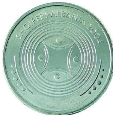
Sh. Dekoracion me motive floreale nga mozaiku "Bukuroshja e Durrësit". Në hark "SHQIPËRI - ALBANIA 2004".