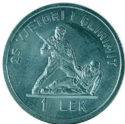
F. Në qendër, partizani triumfues duke kërcënuar me pjesën e pasme të pushkës pushtuesin e rrëzuar. Sipër "25-VJETORI I ÇLIRIMIT" dhe poshtë "1 LEK"