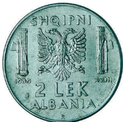
F. Shqiponja dykrenore mes dy "fascio"-ve (tufë shkopinjshtë të lidhur dhe një sëpatë), simbole të fashizmit; vitet "1939" "XVIII" dhe vlera. Në hark "SHQIPNI" dhe "ALBANIA".

Materiali dhe pastërtia: Çelik Pesha: 10,00 Përmasat: Ø 29.2 mm; thellësia e monedhës: 2.3 mm Emetuar nga: Banka Kombëtare e Shqipnis Shtypur në: Zecca di Roma, Mbretëria e Italisë Autorë: Skulptor Giuseppe Romagnoli Çmimi: 208.8 Lekë